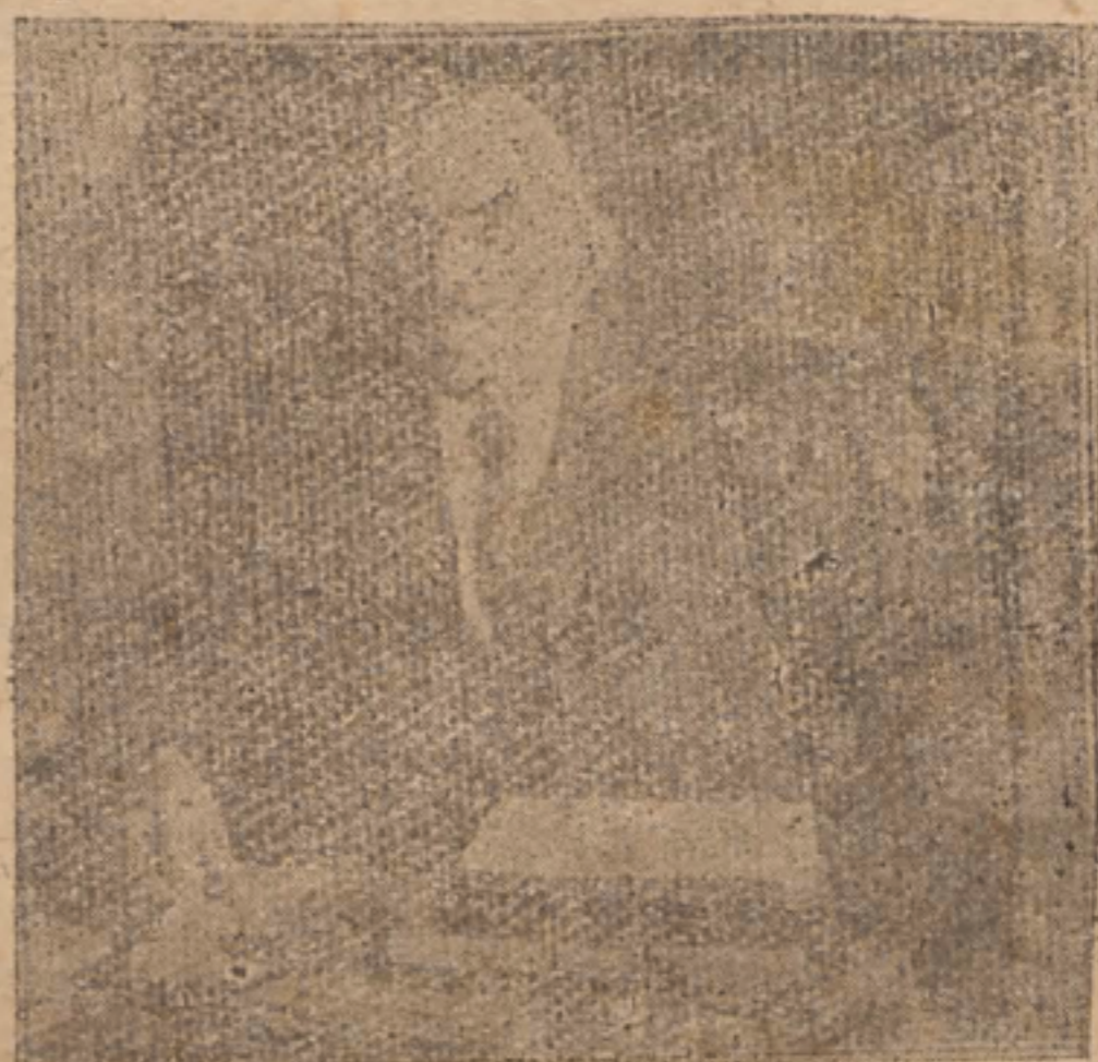
LENIN — 1870 — 1924

Experimentador del Marxismo y vengador de los pobres de Rusia