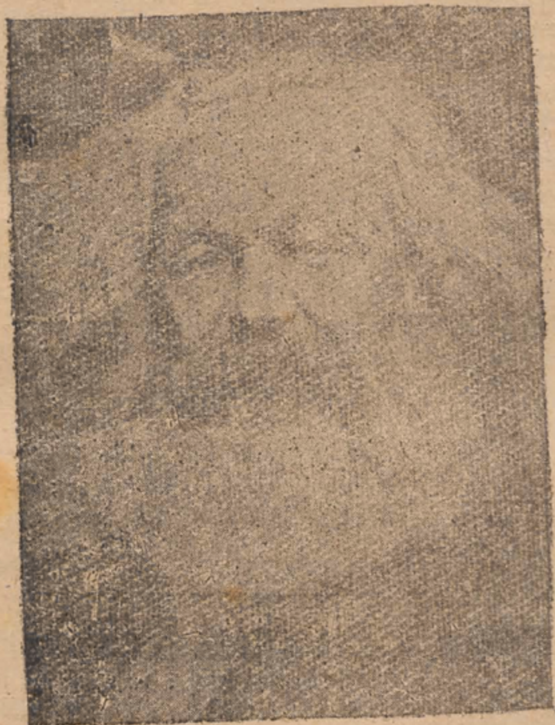
KARL MARX — 1818 — 1883.

Expositor científico del Derecho del Proletariado, cuya doctrina es mal entendida por los pueblos ignorantes y viciosos.