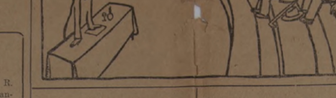
Los Poemas del Mar y de la Estrella

Fragmento de la conferencia pronunciada en la Facultad de Derecho, de Buenos Aires, el 30 de septiembre de 1925.