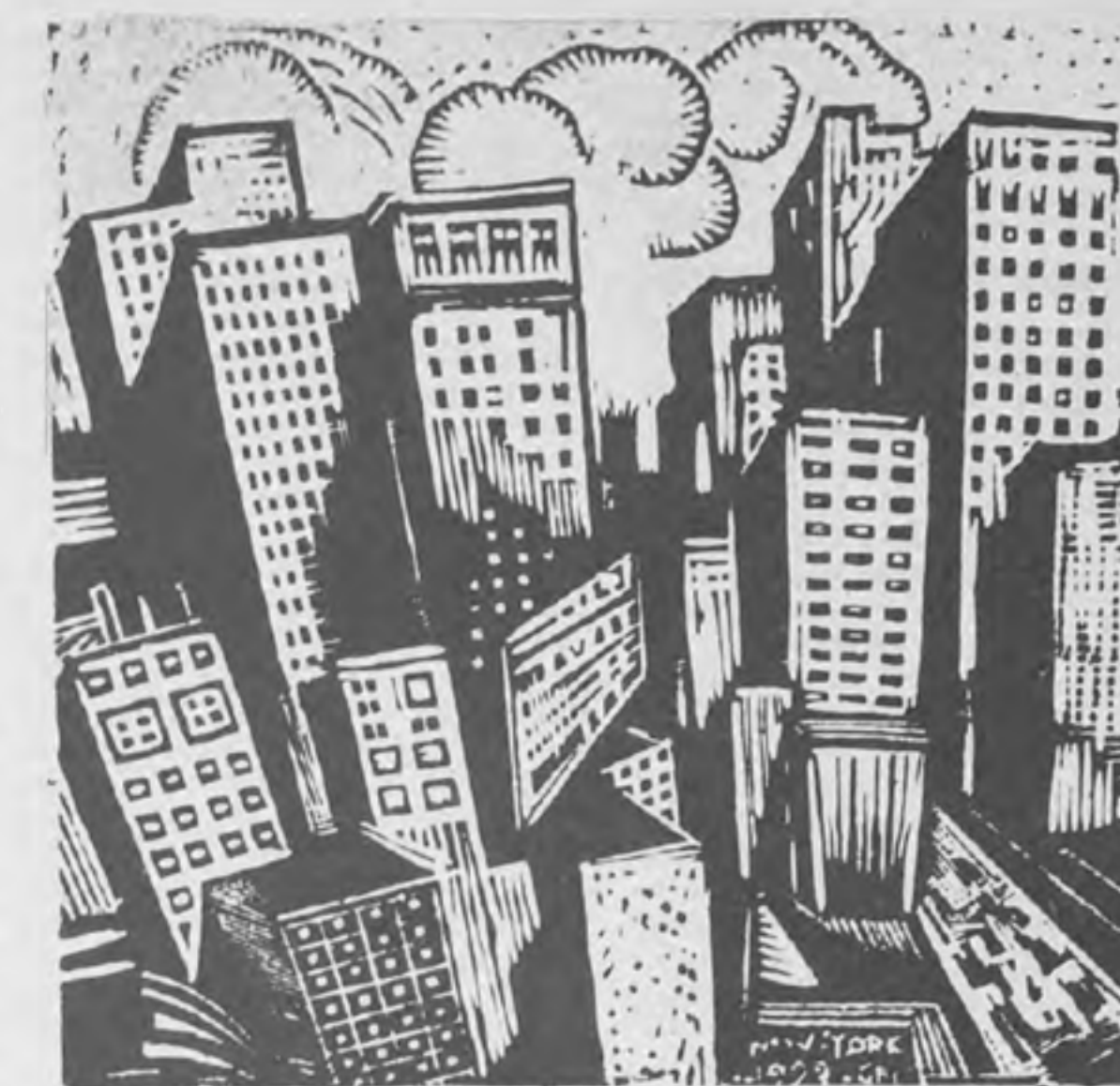
"LA URBE", madera de Gabriel Fernández Ledesma

Quien en Talara no se aviene a este régimen, debe salir inmediatamente de la localidad. La International Petroleum Company ha establecido ahí una disciplina conventual. Cuando un trabajador, por cualquiera razón no le conviene, o le es sospechoso, la Compañía lo notifica de que dentro del plazo de 24 o 48 horas debe salir de Talara con su familia. Sa-