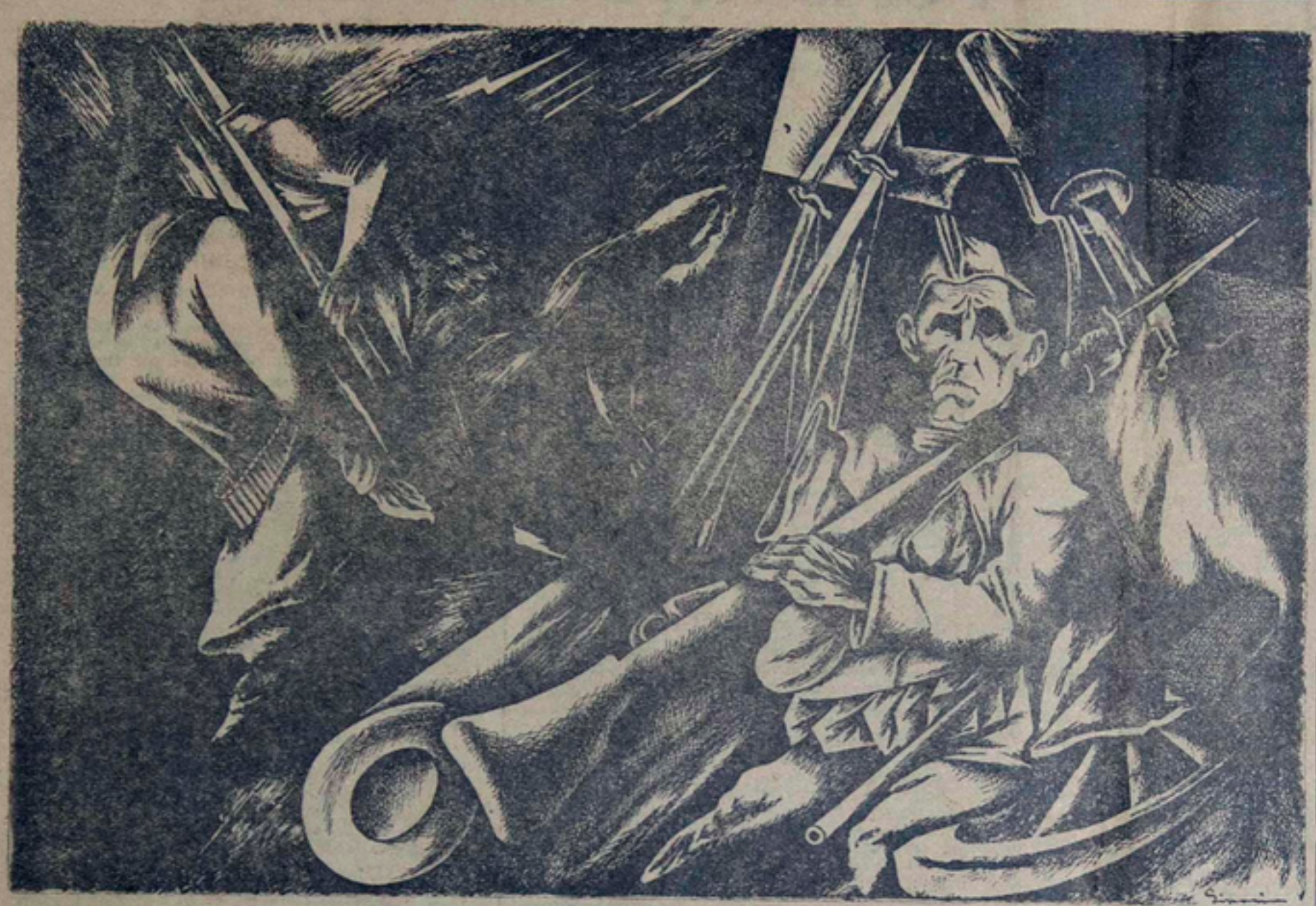
ILUSTRACION DE MITCHEL SIPORIN

Un nuevo libro de Setaro. Libro de pasión y de combate, en el cual el lector encontrará verdades de a puño, y dichas, lo que es mejor, con toda valentía y seguridad. Se trata de un libro que causará sensación por la documentación que exhibe y los asuntos de que trata. Nosotros en esta simple crónica nos anticipamos al comentario y señalamos su profundo interés, puesto que el autor se refiere a uno de los dramas americanos más sombríos y terribles que ha dejado tendidos en el desierto del Chaco sesenta mil cadáveres. Holgadamente comentaremos este libro fuerte y denso, acontecimiento extraordinario y documento memorable para la literatura mundial.