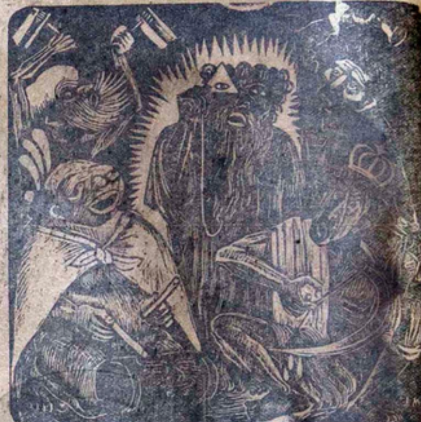
RIVERA Y SQUEIROS, GRABADO DE MENDEZ