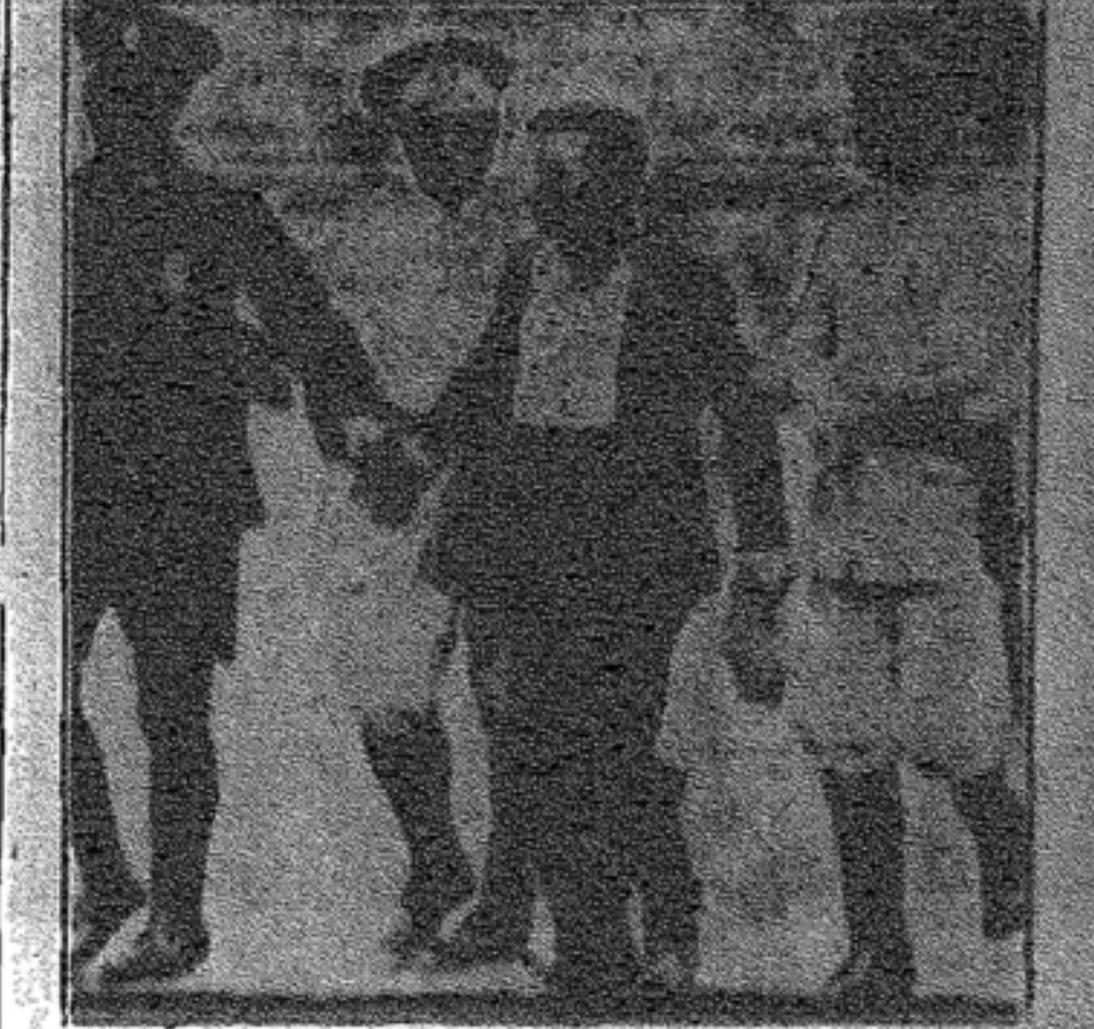
Todos los días, después y antes del 6 de setiembre, como antes y luego del 20 de febrero y a cada momento, la paga burguesa es solo lote de plomo, esclavismo y hambre para los proletarios.

El rebelde es una roca entre el barro. Todas las salpicaduras que el lodazal que le rodea escupe, se estrellan en su mole y chorrean por su flanco. Pero ni una lo penetra ni lo mancha; todas juntas son impotentes para desvalorizar su valor de piedra, de fuerza limpia que se abre paso entre la debilidad inmundicia.