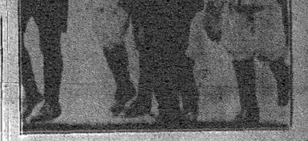
Todos los días, después y antes del 6 de setiembre, como ahora y luego del 20 de febrero y a cada momento, la paga burguesa es sólo lote de plomo, esclavismo y hambre para los proletarios.

Imposible nos resulta mencionar a todos los que han pasado por las mazmorras policiales o que permanecen aun en ellas. Basta decir que los habituales lugares de detención estuvieron colmados, y que en el Cuadro 5 del Departamento la aglomeración de presos llegó a tal punto que fué preciso turnarse para poder dormir apretados.