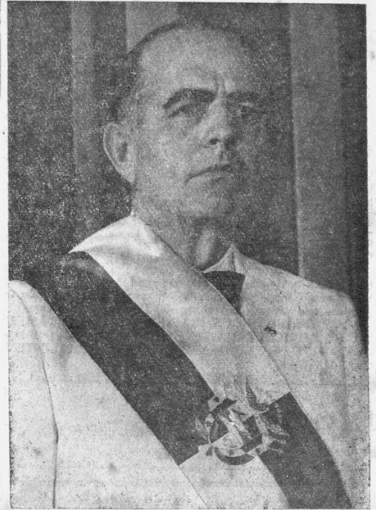
DON ROBERTO F. CHIARI

Castro gradualmente se apoderó de todas las riquezas del país. Siempre tenía un pretexto, hasta que terminó con todos los nego-