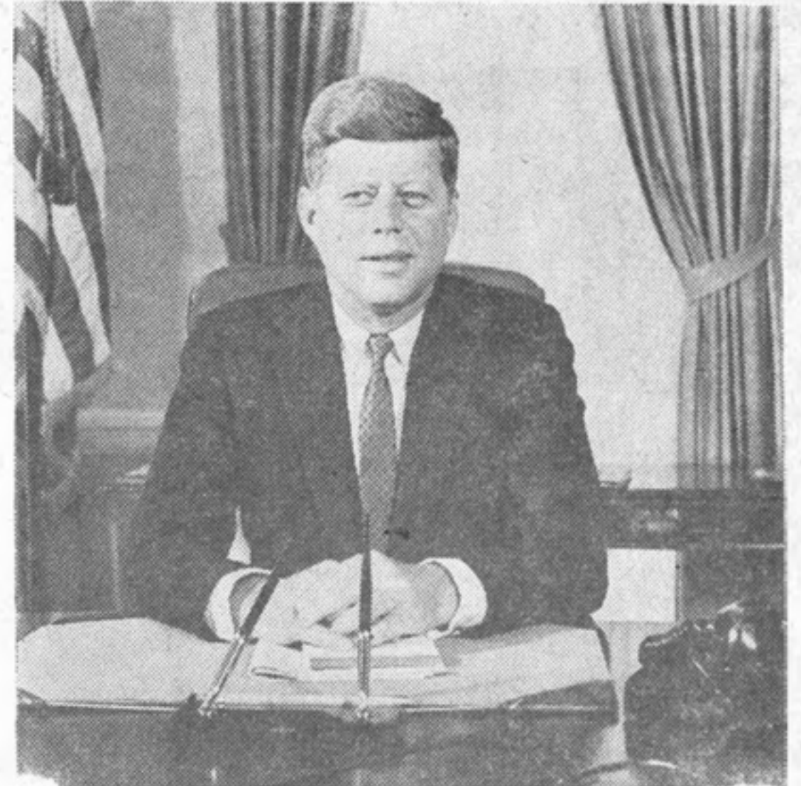
El Presidente John F. Kennedy ante su escritorio en la Casa Blanca, en Washington.

(1858-1919), vigésimo quinto Presidente de los Estados Unidos, de 1901 a 1909. Inició diversos planes de conservación, destinados a salvar los recursos naturales de la nación, y otros de tipo administrativo para fomentar el control federal sobre el comercio entre los diferentes estados de la Unión. Recibió el Premio Nobel de la Paz correspondiente a 1906.