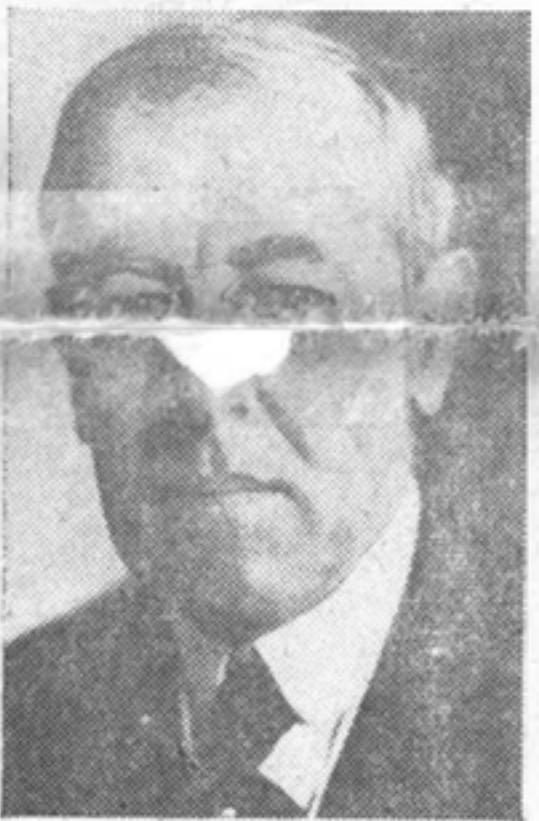
THOMAS WOODROW WILSON

El más joven presidente de los Estados Unidos tomó las riendas del poder de manos del más viejo servidor de la Casa Blanca con la solemne promesa de que "pagaremos cualquier precio, soportaremos cualquier carga, haremos frente a cualquier dificultad, ayudaremos a cualquier amigo, nos opondremos a cualquier enemigo para asegurar la sobrevivencia y el éxito de la libertad".