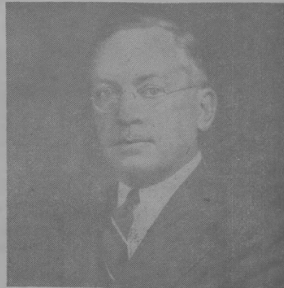
CORONEL FRANK H. WANG Asistente del Gobernador de la Zona del Canal

Somos de opinión que no debamos vacilar en decir a nuestros amigos cuanto apreciamos su amistad, y su caridad a favor de nosotros. El Local 713, Trabajadores Públicos Unidos de América-CIO tiene muchos amigos en el Istmo de Panamá. Amigos en puestos altos, amigos de carácter e integridad, amigos de mucho valor y los saludamos.