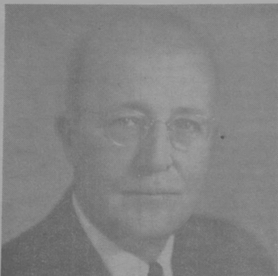
MAYOR GRAL. J. C. MEHAFFEY Gobernador de la Zona del Canal