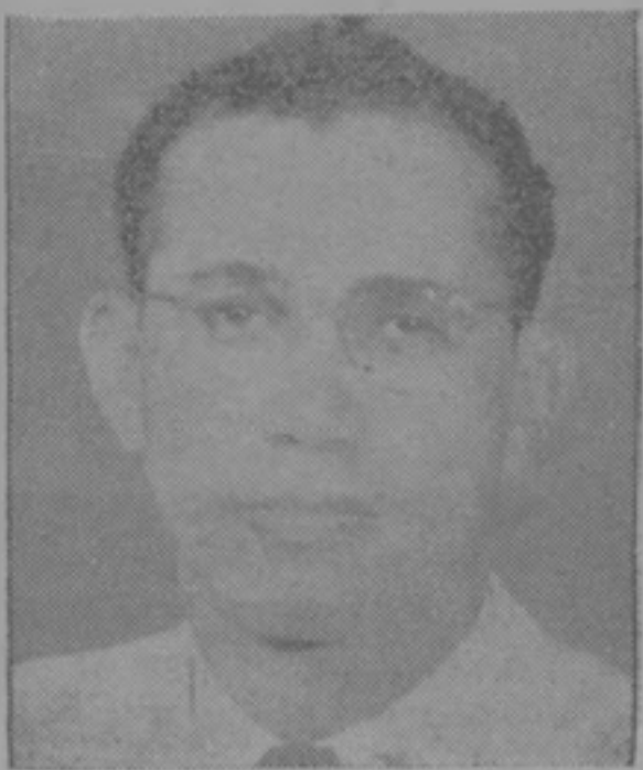
DON VICTOR NAVAS Gobernador de la Provincia de Colón

Creemos que ningún hombre puede luchar por sí mismo sin que la lucha ayude a otro. Que al luchar por su pueblo también lucha por otros. Queremos felicitar muy sinceramente al Dr. Alfaro por su labor sobresaliente en la Reunión de las Naciones Unidas y darle nuestras más expresivas gracias por su contribución a favor de la clase trabajadora.