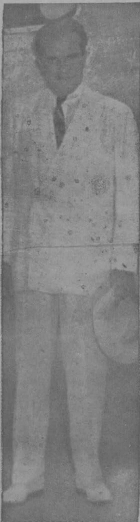
DON E. A. JIMENEZ Presidente de la República