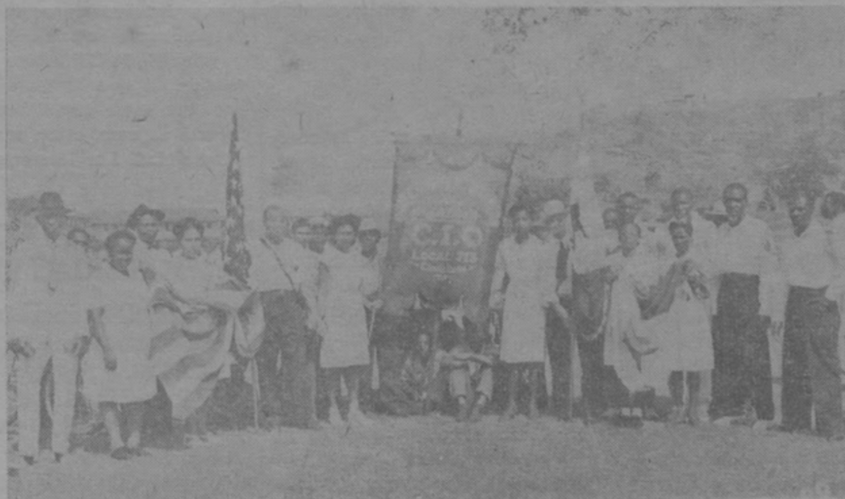
2. Arriba vemos el estandarte de la Unión en medio de las banderas Panameñas y Americanas. Delegados de la Unión llevaron las banderas.

En el lado del Pacífico las unidades de la División de Comisariato fueron muy impresionantes en sus uniformes blancos y su propio estandarte. La parada fue encabezada por la Banda de la Comunidad y tres ciclistas vestidos de camisas blancas y pantalones chocolates con las iniciales