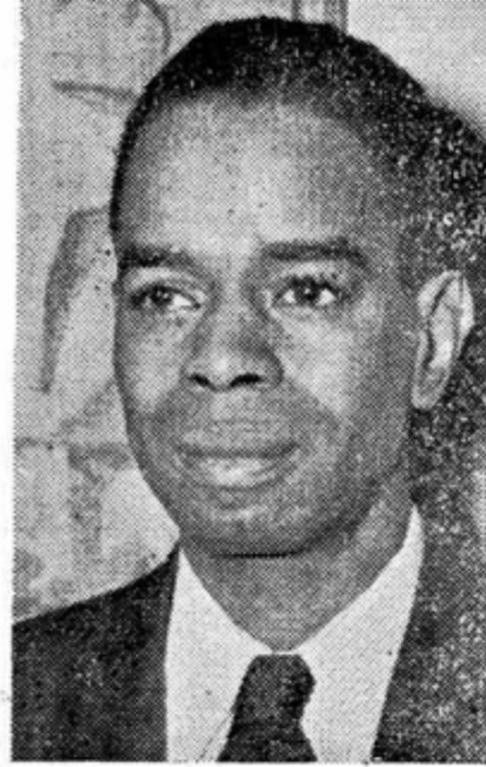
International Vice-President Vice-President Internacional