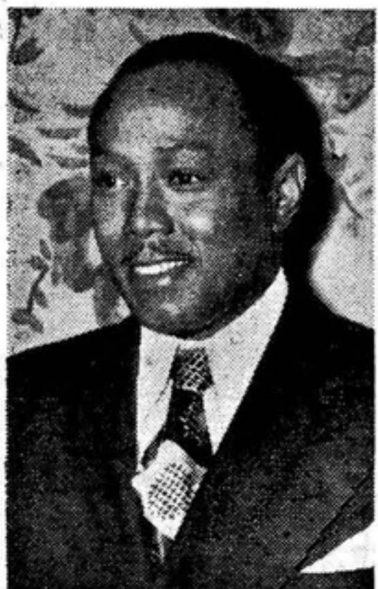
Miembro del Consejo Ejecutivo Executive Board Member