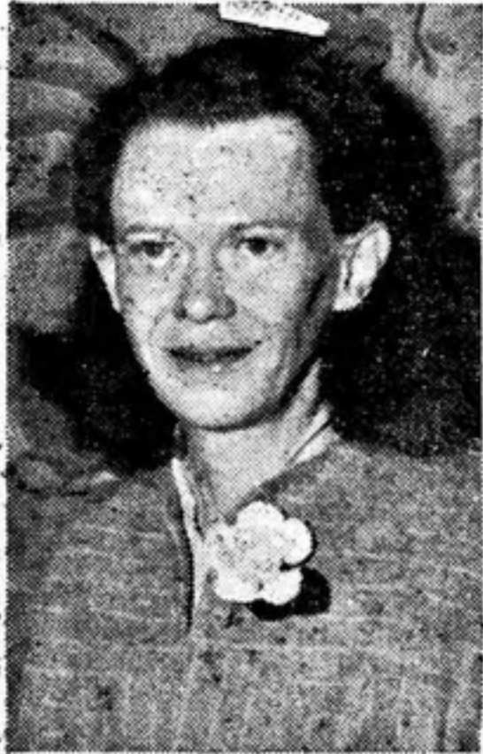
Secretaria-Tesorera Inter- nacional International Secretary- Treasurer