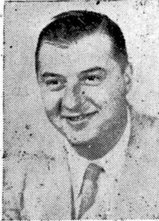
Director Internacional de Educación International Director of EDUCATION