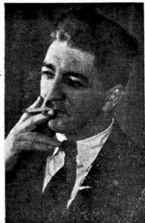
Director Internacional de Or- ganización International Director of Or- ganization

INTRODUCIENDO LA DIRECTIVA INTER- NACIONAL DE LA UNION DE TRABA- JADORES PUBLICOS UNIDOS—CIO— AL CUAL HEMOS SIDO AFILIADOS