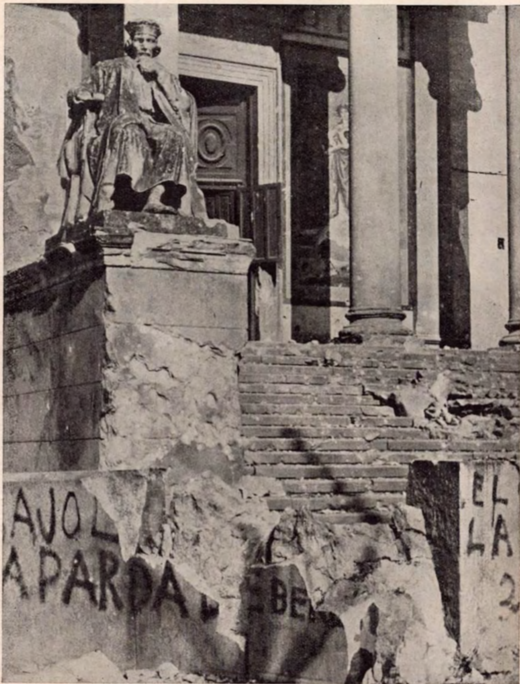
También lanzaron bombas los pilotos extranjeros sobre el Museo Antropológico. Así quedó la fachada del vetusto edificio.