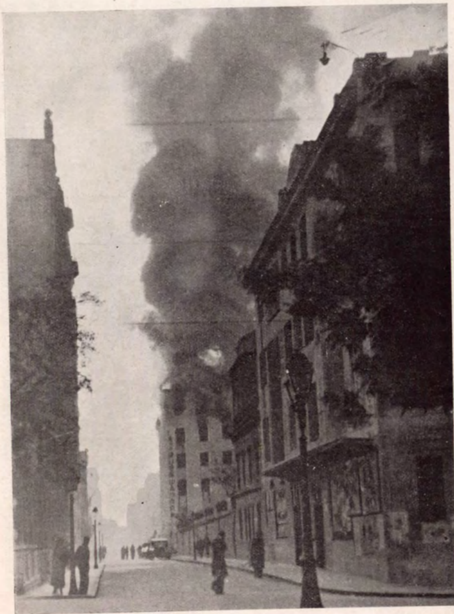
Una calle de Madrid, pocos minutos después de haber sido bombardeada por los colaboradores internacionales de los facciosos españoles.