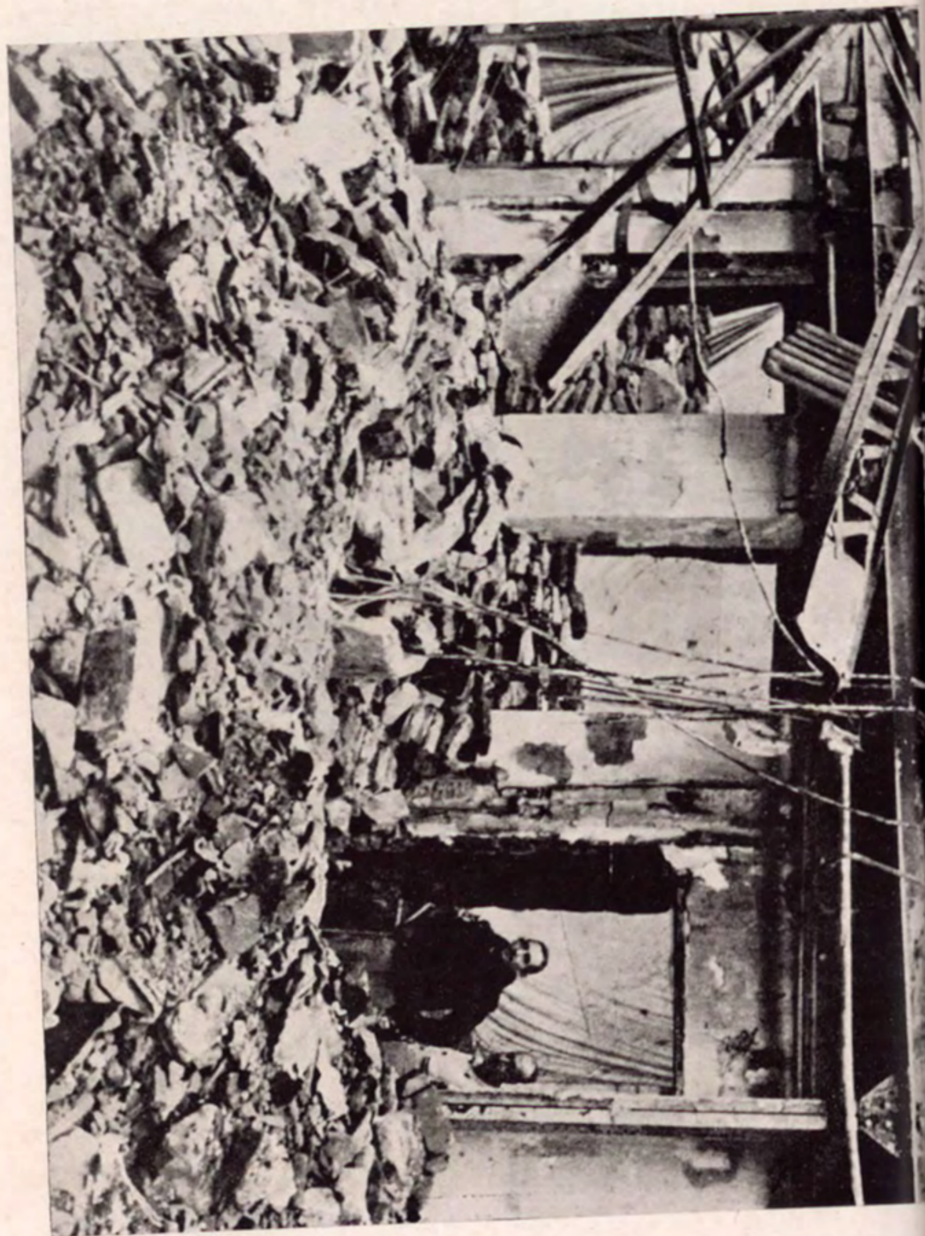
Como dejaron los aviadores al servicio de Franco, los aviadores de Italia y Alemania, el edificio del diario «La Libertad» en Madrid.