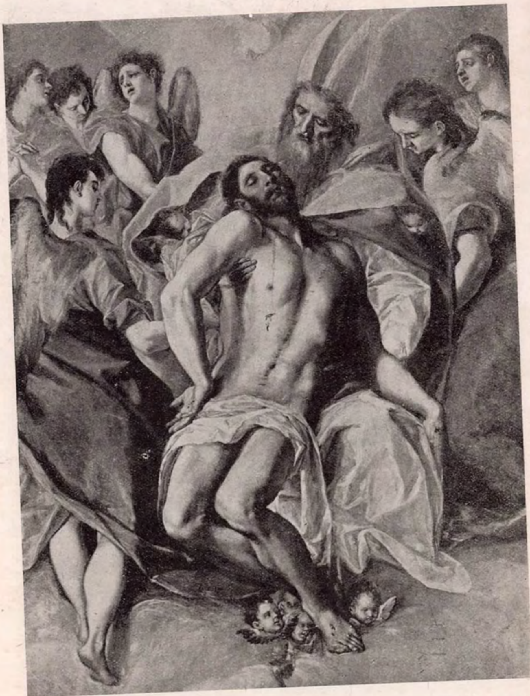
«El descendimiento», cuadro del Greco salvado por las milicias populares durante un bombardeo fascista del Museo del Prado. Creyó Jesús que con su sangre podría lograr la redención del mundo. Hoy corre a raudales la sangre de los redimidos, acogidos al nombre del Redentor.