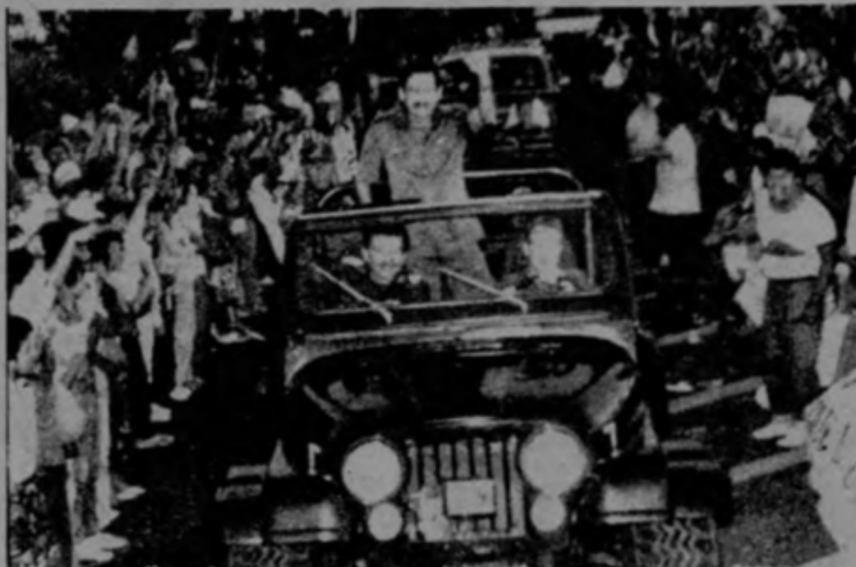
El Pueblo de Nicaragua hizo vallas humanas a los bordes de las calles de Managua, para despedir a sus delegados de Sapoá, y exigirles firmeza en la defensa de las conquistas populares.

dente nicaragüense, Daniel Ortega, dijo en esa ocasión que la contra estaba utilizando una táctica dilatoria debido a presiones de la administración Reagan, que persiste en la opción armada para derrocar a la revolución popular.