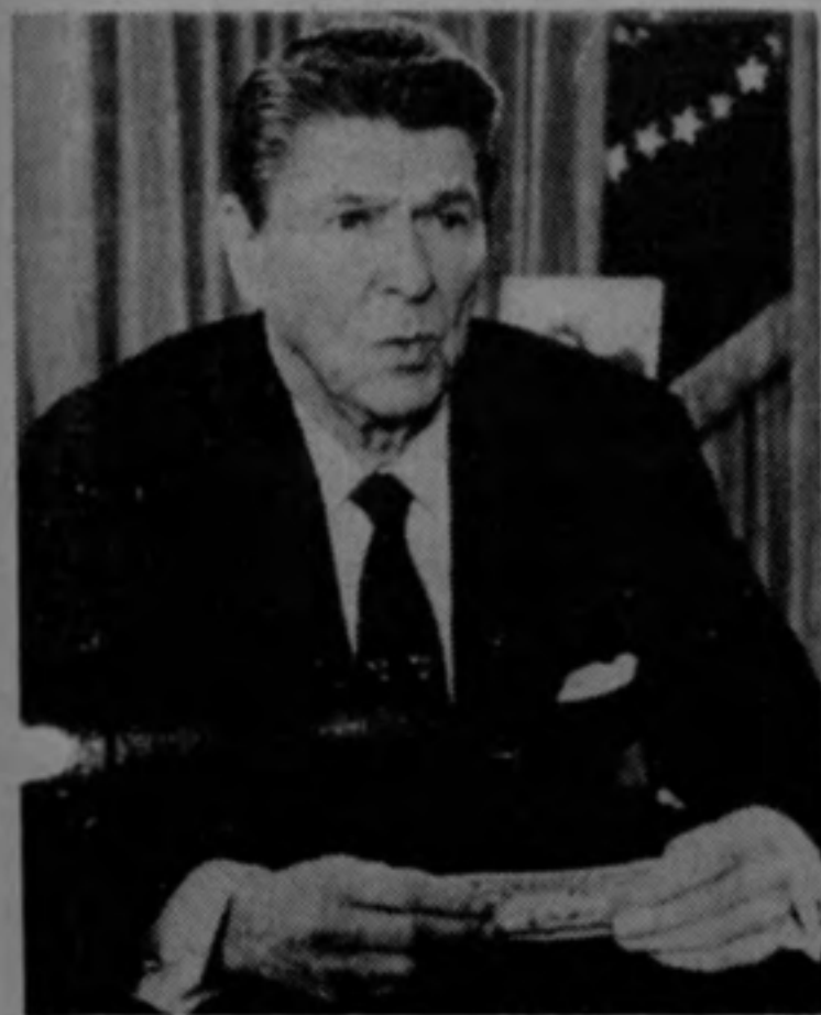
Reagan organizó el plan....

Según ha trascendido en medios políticos y de prensa en Washington, Reagan