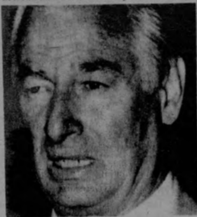
...Azcona lo aplicó servilmente.

Las únicas versiones en tal sentido emanaron exclusivamente de altos funcionarios del gobierno y el ejército hondureños, sin probar el hecho, y a nadie se le permitió acercarse a la zona donde supuestamente ha-