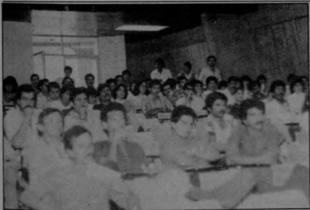
Los trabajadores de la UCR aprobaron ir al paro en la Asamblea del martes.

Este martes, docentes, administrativos y estudiantes llevaron a cabo una manifestación de protesta exigiendo del Consejo Universitario la derogatoria de la medida adoptada. Sin embargo, el acuerdo de despido fue ratificado. En vista de ello, para los próximos días se promoverán nuevas acciones en las que se pretende involucrar a toda la comunidad herediana para lograr que la UNA no se cierre.