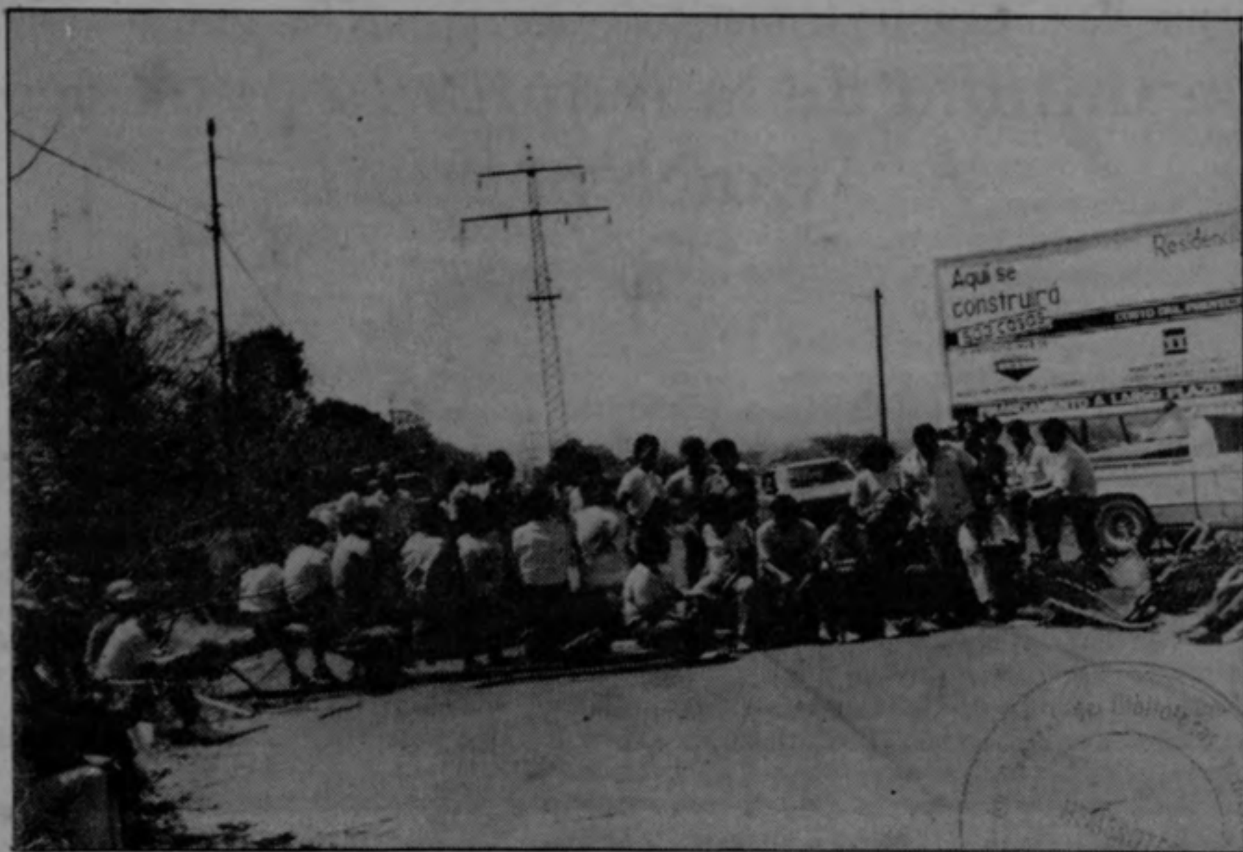
En el bloqueo participaron mujeres y niños, quienes contribuyeron decididamente al triunfo.

Dos bloqueos simultáneos de vías realizaron este martes los vecinos de Lomas del Río en Pavas, aprovechando la presencia en el lugar de los ministros de Educación y Obras Públicas.