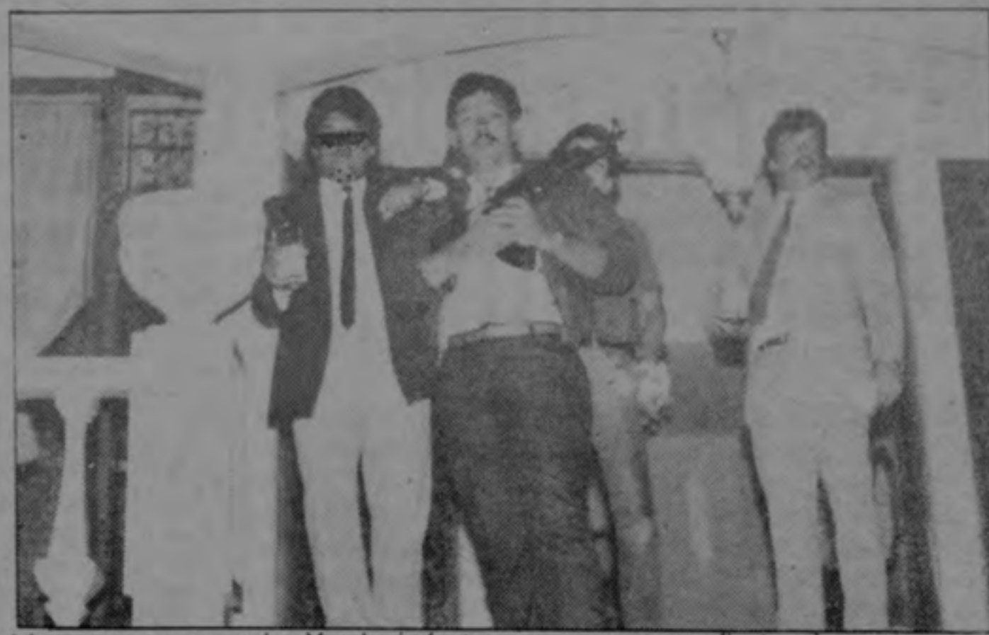
(arriba) hace pocos meses los Yasdani efectuaron una suntuosa fiesta a la que invitaron a personajes de la vida política y económica del país. Se sentían tan seguros que sus guarda-espaldas se pasearon y retrataron con sus "instrumentos de trabajo"