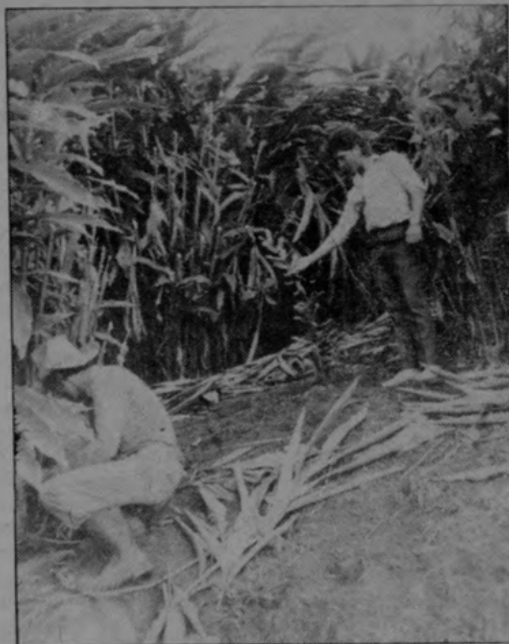
El trabajo es duro, por un salario de ₡ 1800 semanales que, además, en estos momentos es muy incierto porque nadie sabe si cada sábado van a recibir lo que les corresponde.

Esto ha provocado que muchas labores en La Yama se paralicen y a los operarios que manejan tractores, equipo pesado y camiones, los están mandando al campo a hacer labor de peones.