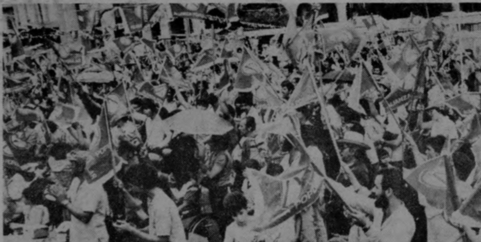
El Tribunal pretende mantener fuera de ley a un grueso número de costarricenses que militan en la izquierda.

El Tribunal Supremo de Elecciones, en resolución del 20 de enero de 1988, consideró que el acuerdo de los presidentes centroamericanos "Esquipulas II", no está en vigencia en el país.