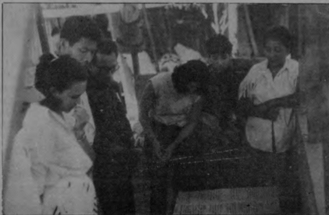
El trabajo colectivo para ser el rompecabezas, permitió reafirmar la importancia de la unidad y la organización para salir adelante.

Vendamos y paguemos puntualmente nuestro periódico.