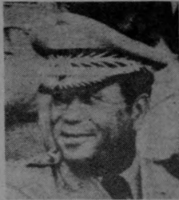
General Namphy nuevo dictador de Haití

La Habana, /TASS/. El Consejo Electoral Provisional en Haití, cuya mayoría de componentes ha sido designada por el régimen gobernante del general Henri Namphy, se ha visto obligado a excluir de la lista de pretendientes al puesto de presidente del país la candidatura de personas que colaboraron con el ex dictador Duvalier. Las autoridades han tenido que recurrir a esta maniobra táctica para prevenir el estallido de ira popular en vísperas de las denominadas elecciones generales del 17 de enero, unánimemente calificadas de farsa electoral por vastos círculos de la opinión haitiana e internacional.