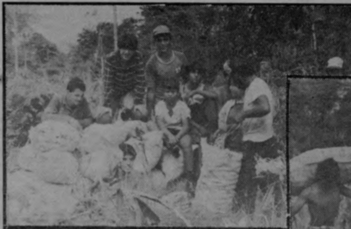
Los campesinos de El Indio han recibido el apoyo de varias organizaciones para mantenerse en su lucha

Por otra parte, un grupo de diputados de todos los partidos emitió este miércoles un comunicado llamando al gobierno de la República a entablar una negociación seria con los campesinos.