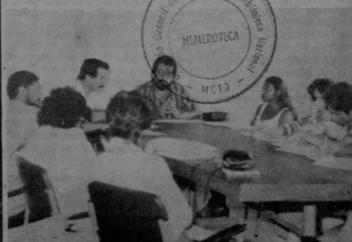
Los dirigentes comunales intercambiaron experiencias sobre las luchas llevadas a cabo para conquistar vivienda.

Parte del intercambio de experiencias se llevó a cabo en la finca que fuera recientemente adquirida y donde pronto se inaugurará la Ciudadela Carmen Lyra, por cuyo objetivo han luchado durante cientos de territorialbeños.