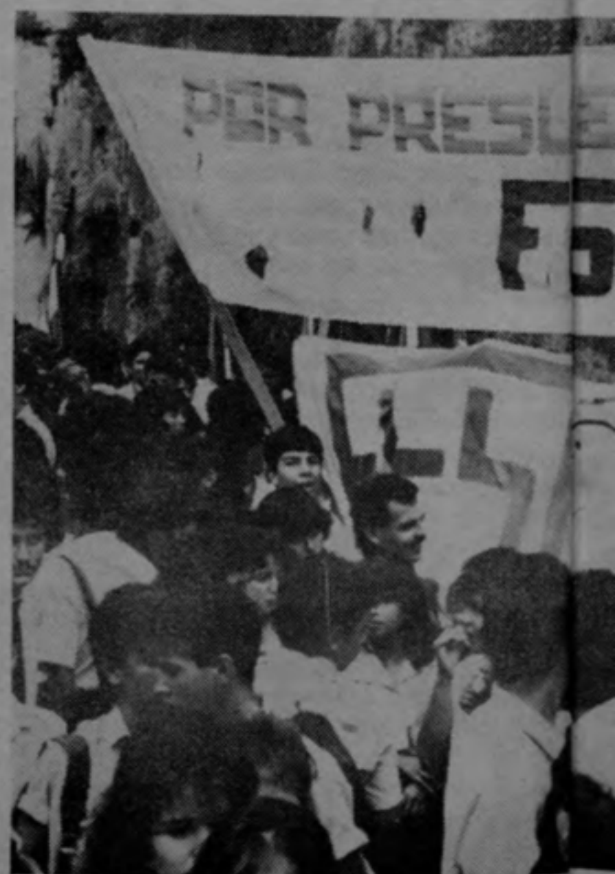
La Federación de Estudiantes anda siempre, en primera fila.