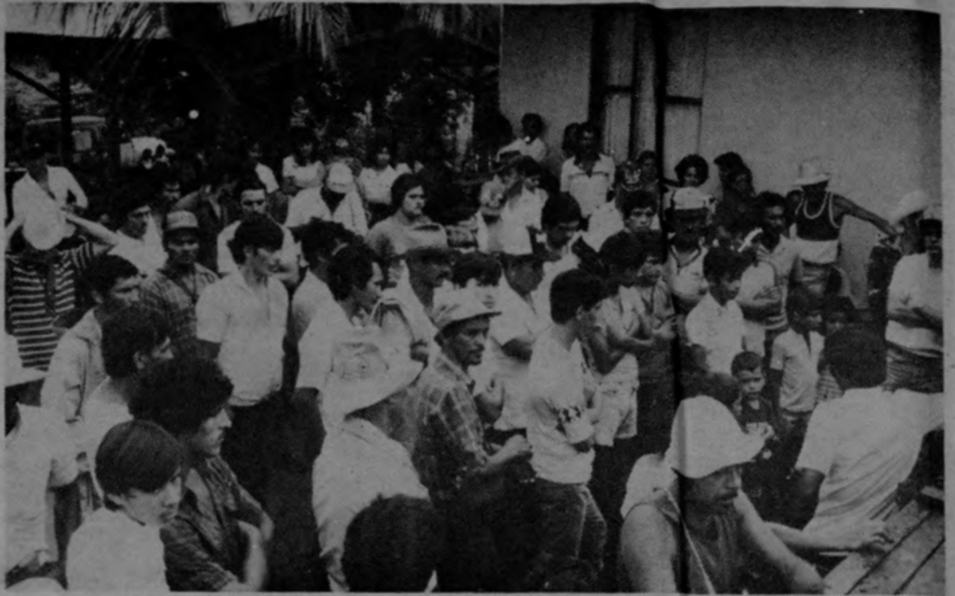
Los campesinos lo único que demandan es que los dejen de engañar y que responsablemente los personeros del IDA negocien la entrega de los títulos.

La ocupación, desde la mañana del jueves 15, de la oficina regional del IDA por varios centenares de campesinos de El Indio, distrito de Cariari de Pococí, es una contundente respuesta de los precaristas a la pretensión del instituto agrario de cobrarles por las parcelas sumas elevadísimas, que oscilan entre 12 y 24 mil colones por hectárea.