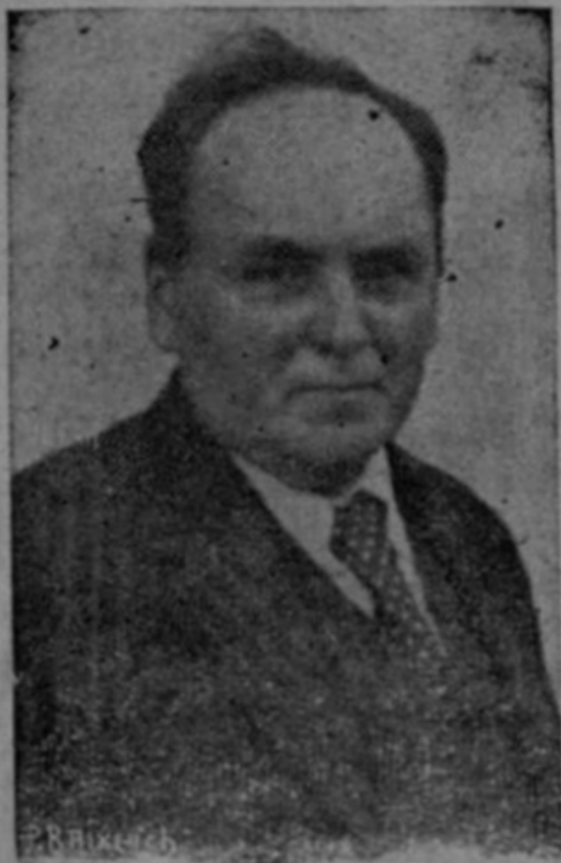
Prof. J. GARCIA MONGE

Primer candidato a diputado por San José