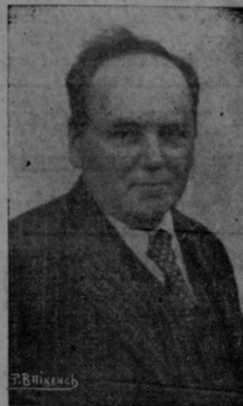
Prof. don J. GARCIA MONGE Encabeza la papeleta de diputados del P. P. I. por San José