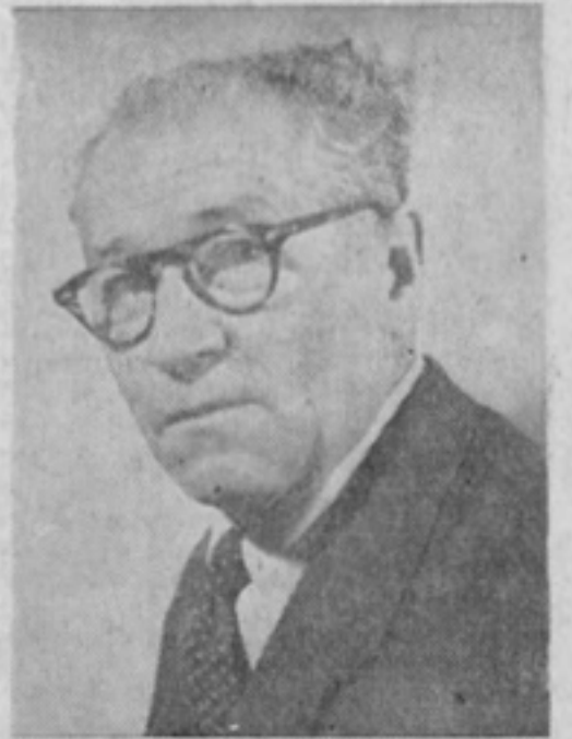
Don SATURNINO RODRIGO Embajador de la República de Bolivia

Pasó el tiempo. Los indios de las más apartadas regiones de América, como si fueran los sa- cerdotes encargados de guardar el culto, conservaron todas las virtudes de la raza y sus oídos siguieron escuchando las voces de la Naturaleza, y en sus ins-