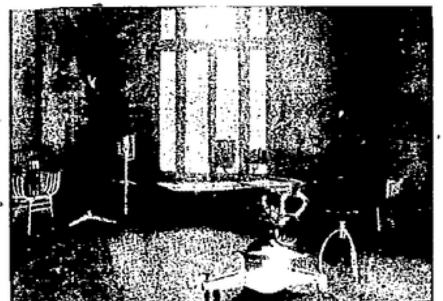
El Quirófano del Sanatorio