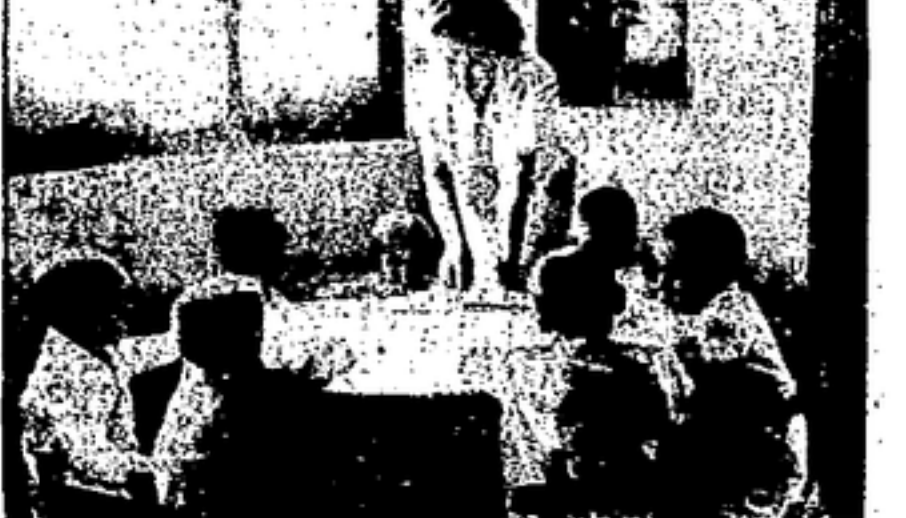
La infancia de la España Revolucionaria, instruída y cultivada amorosamente

«El capital de la Socialización estará formado por los muebles, enseres, utensilios, máquinas y efectivo metálico