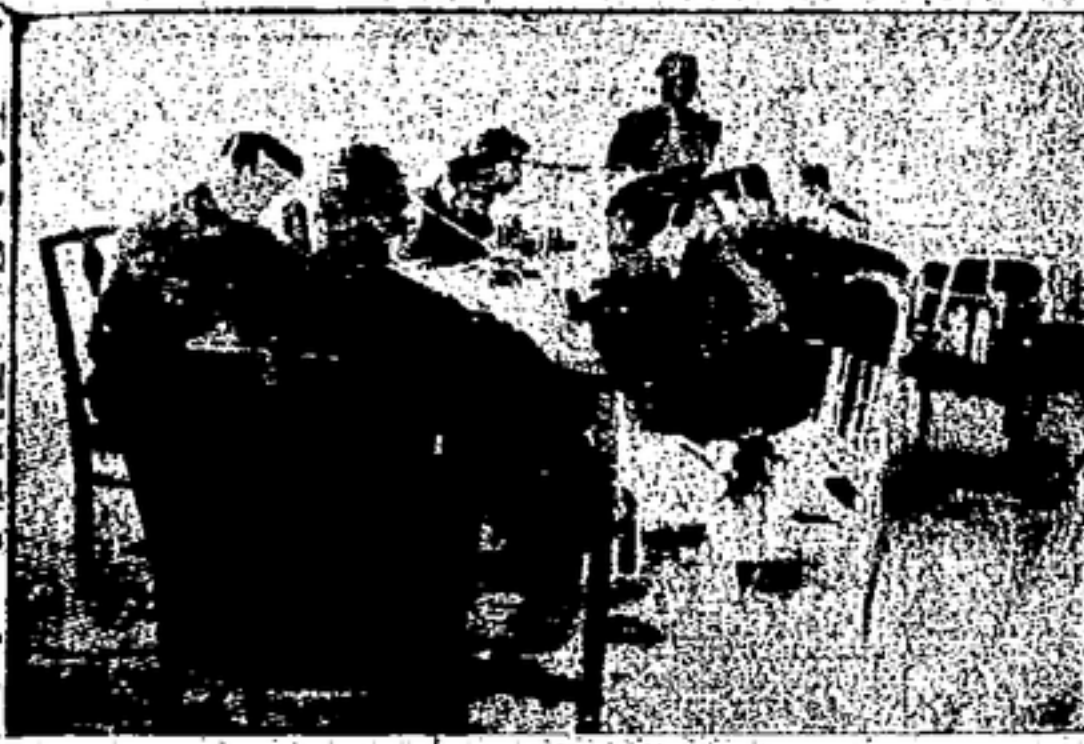
Una clase en la Escuela.