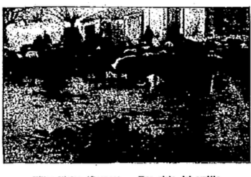
Villas Viejas (Guenca). — Una vista del cortijo