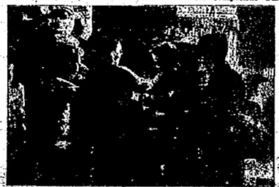
Después de las comidas, las criaturas se entregan alegremente a sus juegos. Aquí les vemos ordenando las piezas de un rompecabezas.

la C. N. T. en el ámbito nacional y con segura trascendencia mundial, a poco que la situación mi-