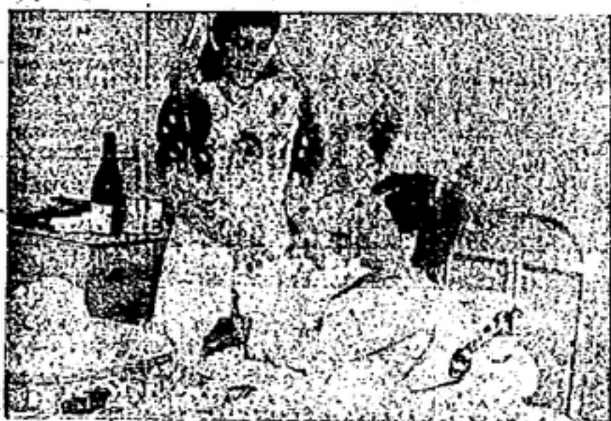
El parto ha tenido felices resultados, y la criatura hace galas de robustez con un llanto revelador de magníficos pulmones.

Hemos señalado, entre mil hechos que jalonan la epopeya de un pueblo. El