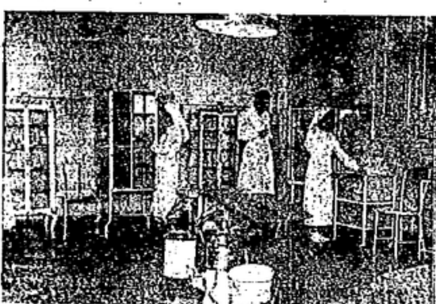
El magnífico quirófano del Instituto. Al centro, una de las dos mesas de operaciones. Al fondo, las vitrinas con el Instrumental de Toco-ginecología.

Como ya hemos mencionado, durante los bombardeos, enfermeras y médicos abandonan el edificio, sino que acuden a las enfermas y parturientas para tranquilizarlas con su presencia.