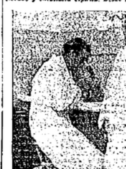
Laboratorio de análisis clínicos. Detalle de los potentes microscopios.

car la obra realizada por el personal del establecimiento, animado del más elevado y entusiasta espíritu. Desde las