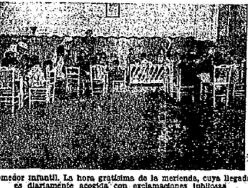
Comedor infantil. La hora gratísima de la merienda, cuya llegada es diariamente acogida con exclamaciones júblicas.

car la obra realizada por el personal del establecimiento, animado del más elevado y entusiasta espíritu. Desde las