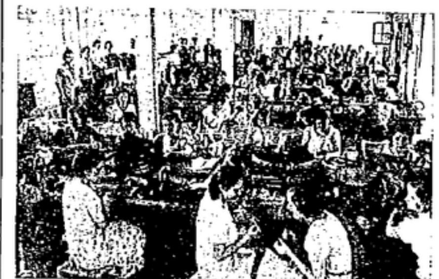
solución sobre medidas a adoptar por las Federaciones nacionales de industria para evitar el encarecimiento del costo de la vida y conseguir la mayor reducción posible de éste. Además, varias comisiones específicas están estudiando interesantes proyectos, destacándose entre otros, por su interés económico, el de subvención de diversos productos sucedáneos que, si dan resultados favorables en las pruebas que seguirán a la aprobación de los proyectos, permitirían un incremento de diversas ramas industriales y una economía importante de divisas en beneficio de la guerra.

—TIENEN ADOPTADAS LAS SECCIONES ALGUNA ESPECIAL SUBDIVISION EN DEPARTAMENTOS?— «Efectivamente, la tiene. Cada Sección se subdivide en Subsecciones o departamentos. Con sólo leer su nombre se comprende el cometido que tienen asignado. Secretaría General tiene, entre otras de menor importancia, los de Secretaría auxiliar, Correspondencia, Registro Bibliotecario, Archivo e Índices, Contabilidad, Pagaduría y Traducciones. Estadística de la general de la Nación y el de Delimitación, Propaganda y Publicaciones, los de Boletín, Revista y demás Publicaciones del C. E. C. Control Administrativo, los de Orientación e Inspección y Oficina de centralización