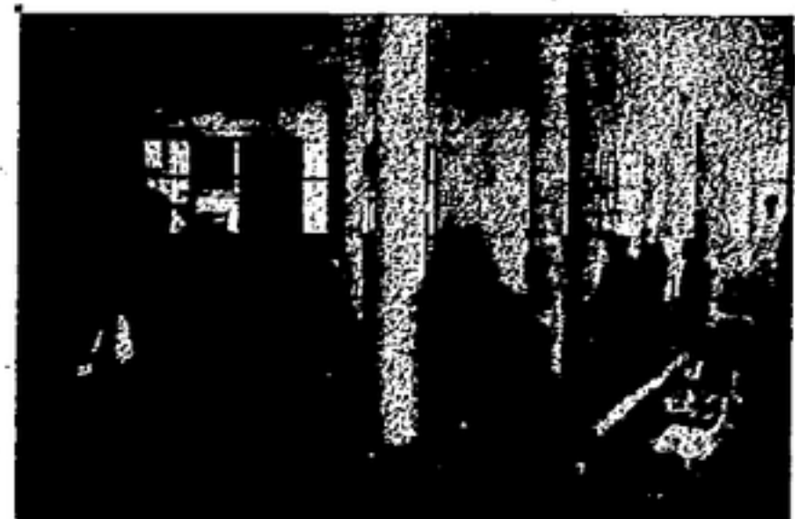
EN PLENA LABOR

—¿Con qué nombre existía antes del 19 de julio? ¿Cuál era el número de afiliados? ¿Pueda decirme en pocas palabras su actuación en los hechos sociales? —Antes del día 19 de julio este Sindicato existía con dos nombres: Sindicato Unico del Ramo de la Construcción y Sindicato Unico del Ramo de Laborar Madera, pero, como es sabido, a raíz del Congreso Regional de Sindicatos, celebrado en febrero de 1937, los dos Sindicatos se fusionaron en uno solo, originando el nombre que lleva actualmente: Sindicato de las Industrias de la Edificación, Madera y Decoración. Cuenta con 45.000 adherentes activos, o sea ochenta y seis mil en los frentes de lucha 15.000 compañeros. Fue el alma, el iniciador de las Secciones de Obras y Fortificaciones. En los mismos tiene unos 10.000 afiliados. Una lucha contra el capitalismo y el Estado se venían por doquiera, pero el Ramo de Construcción encuentra su punto culminante el día 4 de septiembre de 1931, en el antiguo local de la calle Mercaderes (hoy 4 de Septiembre). Desde un grupo de valientes camaradas se constituyeron, que fuese hollado por unas fuerzas mercenarias. Es digno de todo recuerdo la huelga que todo el ramo sostuvo en 1932, que duró cuatro meses y que ganó la jornada semanal de cuarenta y cuatro horas, así al unísono con los obreros abastecedores.