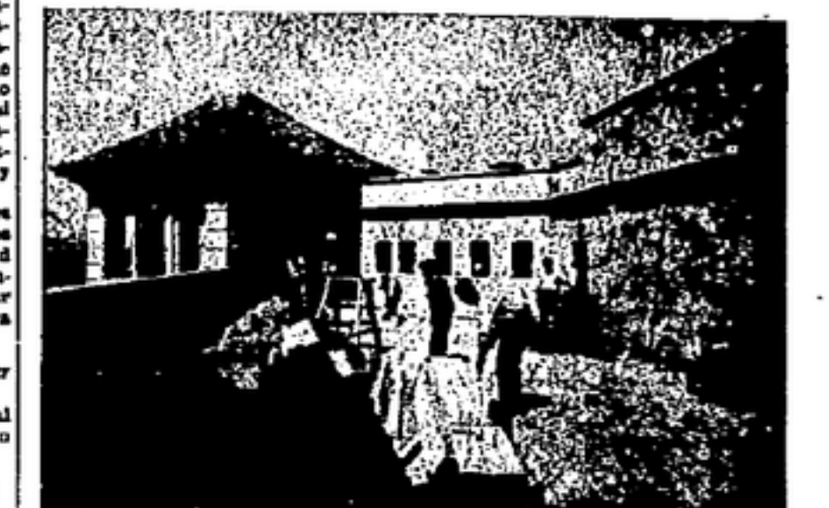
TRABAJANDO EN UN TERRADO

—¿Qué nombre existía antes del 19 de julio? ¿Cuál era el número de afiliados? ¿Pueda decirme en pocas palabras su actuación en los hechos sociales? —Antes del día 19 de julio este Sindicato existía con dos nombres: Sindicato Unico del Ramo de la Construcción y Sindicato Unico del Ramo de Laborar Madera, pero, como es sabido, a raíz del Congreso Regional de Sindicatos, celebrado en febrero de 1937, los dos Sindicatos se fusionaron en uno solo, originando el nombre que lleva actualmente: Sindicato de las Industrias de la Edificación, Madera y Decoración. Cuenta con 45.000 adherentes activos, o sea ochenta y seis mil en los frentes de lucha 15.000 compañeros. Fue el alma, el iniciador de las Secciones de Obras y Fortificaciones. En los mismos tiene unos 10.000 afiliados. Una lucha contra el capitalismo y el Estado se venían por doquiera, pero el Ramo de Construcción encuentra su punto culminante el día 4 de septiembre de 1931, en el antiguo local de la calle Mercaderes (hoy 4 de Septiembre). Desde un grupo de valientes camaradas se constituyeron, que fuese hollado por unas fuerzas mercenarias. Es digno de todo recuerdo la huelga que todo el ramo sostuvo en 1932, que duró cuatro meses y que ganó la jornada semanal de cuarenta y cuatro horas, así al unísono con los obreros abastecedores.