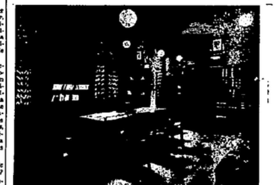
LA BIBLIOTECA DE UN TALLER CONFEDERAL

—¿Habéis realizado alguna obra cultural? —Ha sido siempre nuestra primera preocupación. Aparte de las mejoras de higiene implantadas en todos los lugares de trabajo como son las duchas, los lavabos, los guardarropas, etc., hollados y salas de primeros auxilios, hemos organizado bibliotecas, salas de lectura y conferencias, cursos de preparación de primeros auxilios; hemos construido magníficas pilas de matricación, etc. —¿Qué creéis que es el deber de todos los trabajadores en estos momentos trascendentales para la Revolución? —Todos los trabajadores deben atender a las consignas que dimanen de preparar frentes y cuatro frentes de