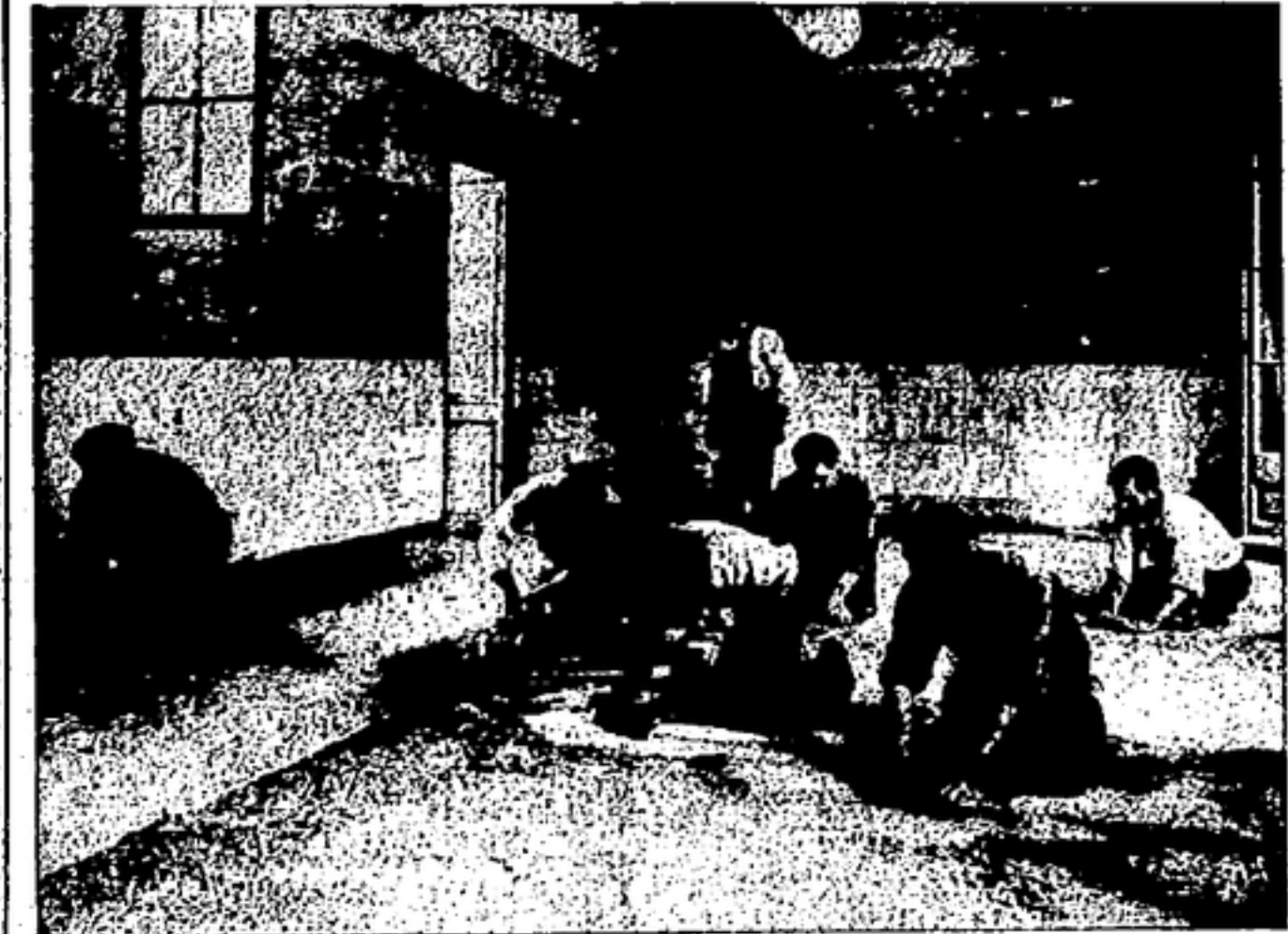
CONSTRUYENDO UN PAVIMENTO ATERMICO