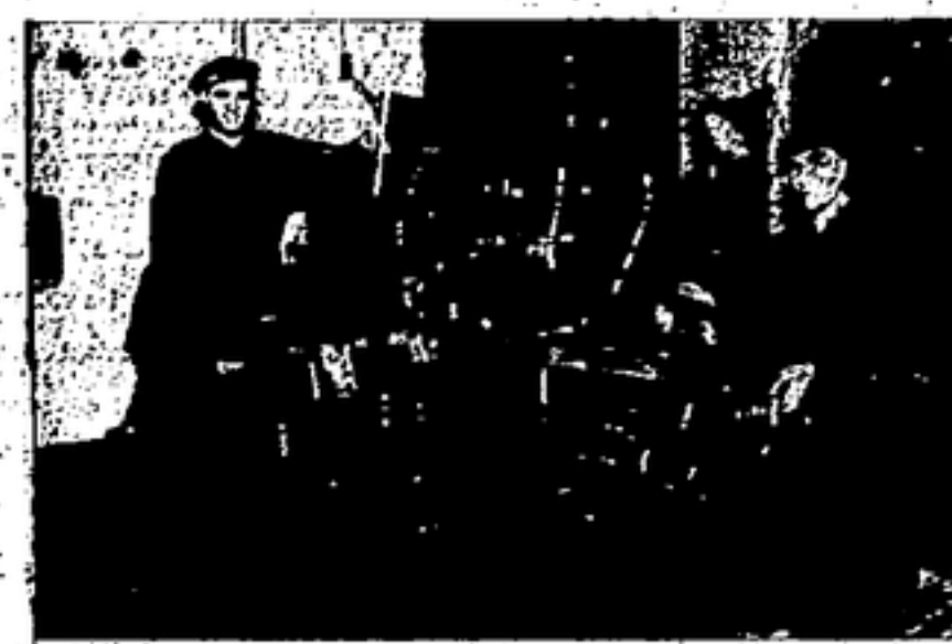
El tornav nueva

de los compañeros, los trabajadores del transporte, reunidos en asamblea, resolvieron, en vista a la apremiante necesidad de restablecer el tráfico de pasajeros, reincorporarse inmediatamente al trabajo. El transporte fue, también el primer servicio socializado que tuvo Barcelona. Nuestra labor fue grande, tanto por la rapidez con que se procedió, como por la seriedad que precedió los actos de todos y por el entusiasmo y espíritu de sacrificio que animaba a los compañeros. Por un lado, el problema de la lucha contra los factores de otras regiones demandaba combates; por otro, las necesidades urgentes de la población requerían una ordenación inteligente y rápida de los servicios. Todos nuestros esfuerzos y nuestra voluntad estuvieron, pues, al servicio de la comunidad.