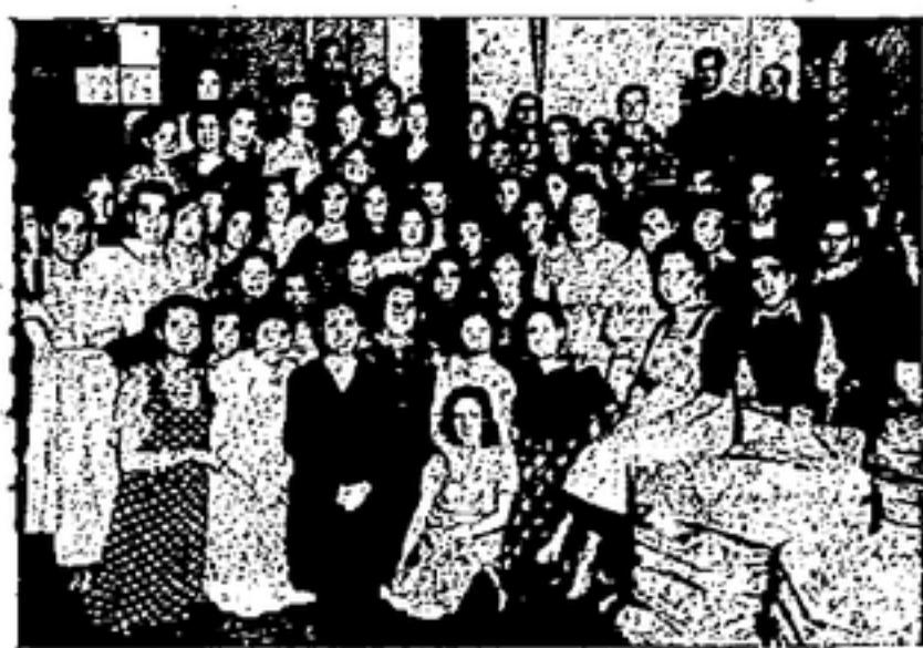
PERSONAL DEL TALLER NUMERO 2