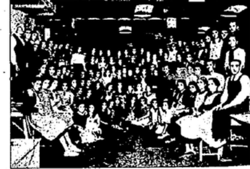
PERSONAL DEL TALLER NUMERO 4

C. N. T. dió pruebas de su capacidad para la organización del trabajo y de sus altos principios mancomunados, llevados a la práctica con honradez y ferre, que vive pensando en el porvenir. Y un joven cuya cara, franca y cordial, resplandece simpática. En la intimidad fraternal de la conversación, como hermanos que se conocen a través del tiempo, nos hacen saber nunca nada de la C. N. T. En vano los compañeros confederados nos instaban a inscribirse en el Sindicato de la vieja Sindical veterana en la lucha por la emancipación de los trabajadores; en vano nos invocaron el nombre de los hijos, la libertad de todos. Todo fue inútil. Un odio recalcitrante nos mantenía alejados de los que ocupaban los primeros puestos en la batalla inconsciente contra el capitalismo y góndos a sus propias conveniencias materiales y morales. Pero llegó el 19 de julio y la brecha hasta lograr la victoria.