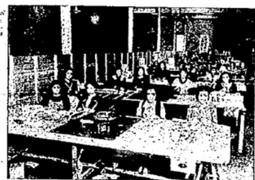
FABRICANDO CAJAS DE FARMACIA

«YO NO QUERIA SABER NADA DE LA C. N. T., HASTA LA ODIABA EN EL FONDO DE MI ALMA, PERO, CUANDO VI LA HONRADEZ DE SUS HOMBRES, SU HEROISMO EXTRAORDINARIO PUESTO A PRUEBA EN LOS DIAS DE JULIO Y EN LOS PRENTE DE BATALLA, LA CORDIALIDAD Y SOLIDARIDAD PRACTICADA POR ELLOS, HUBE DE CONVENCERME DE MI ERROR. HOY, PERTENEZCO A LA C. N. T. ESTOY SATISFECHO Y ORGULLOSO»—NOS DICE EL MAS VIEJO DE LOS OBREROS, PADRE DE DOS COMBATIENTES.