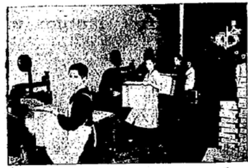
COBIENDO CAJAS DE CARTON

bra confortante y animadora. Ellas, apañadas, ansiosas de grandes gestos, abandonan sus labores y sus labores, nos rodean y nos acosan a preguntas. Pero ellas saben cuáles son sus deberes. Saben que en la renovación de sus propias mentalidades, está el arma más eficaz con que en la retaguardia hemos de destruir para siempre el régimen de opresión capitalista. Por eso, cuando apuyen, como TIERRA Y LIBERTAD, les lleva un rayo de su revolucionaria, lo acogen con fervoroso entusiasmo. Ellas quieren dar todo su esfuerzo y su pensamiento a la construcción de la nueva sociedad. Lo manifiestan categóricamente en una espontánea profección de fe. Es nuestro deber ayudarles a realizar en plenitud.