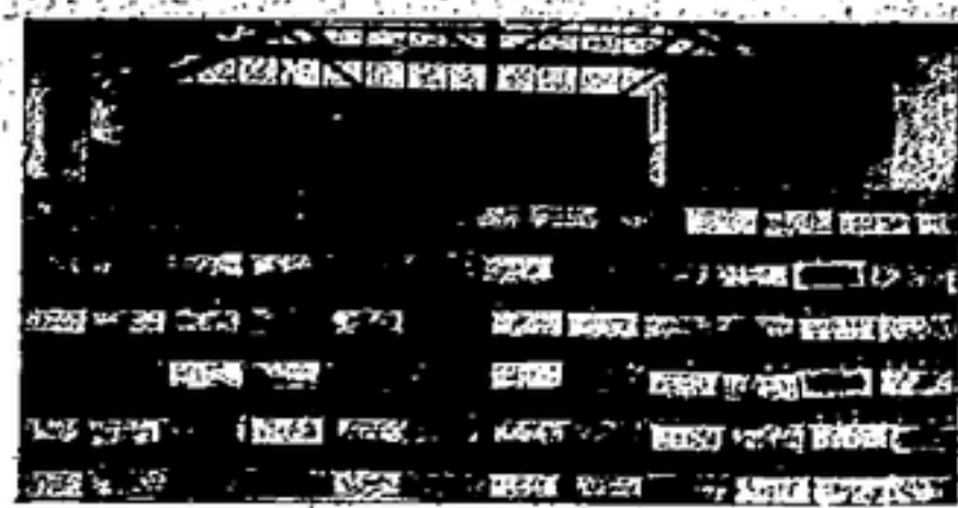
El sabroso líquido envasado y listo para ser enviado a nuestros valientes luchadores

Cataluña, que ha sido la primera en la guerra y en la Revolución, no puede ser burlada en lo que más ama, ni herida por una política que pretende anular lo que ha sido, es y será su bandera en el combate y en el trabajo: LA LIBERTAD