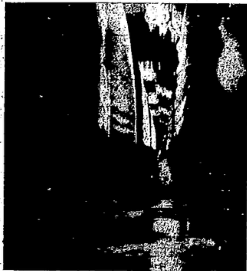
LAS CAYAS: TANQUES

socializada. FABRICA "DAMM" Mientras nuestros combatientes dan la vida por el triunfo de la libertad, los trabajadores de la retaguardia dignifican el trabajo consagrandolo todos sus esfuerzos a la reestructuración económica de la sociedad