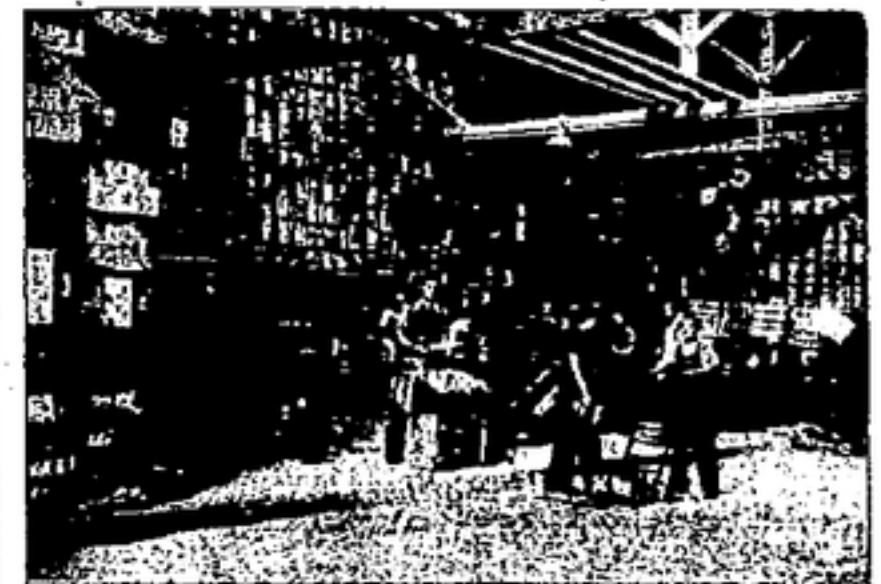
SECCION DE ENBALAJE

Entre los subproductos: levadura, de la que se provee a todos los laboratorios para la fabricación de específicos; dolo carbónico y «Drechs» o «boga» (residuos de la malta).