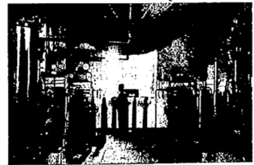
GENERADORES DE ACIDO CARBONICO