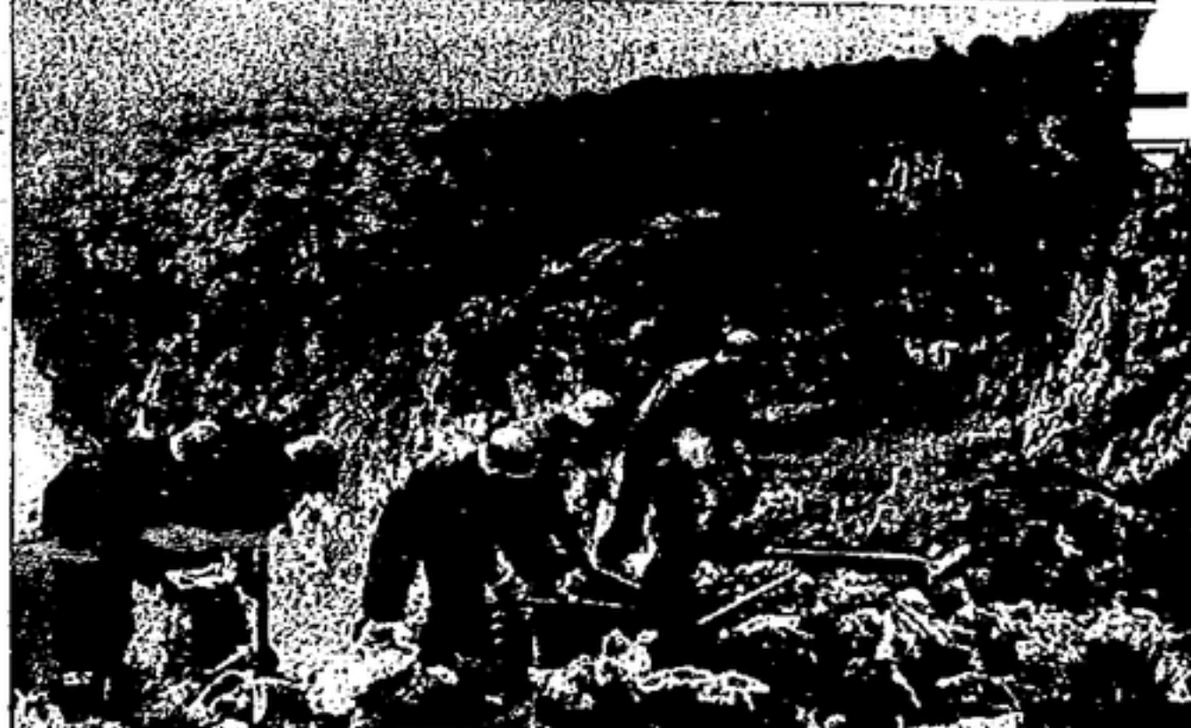
FOTOS DE ASTURIAS CINCO FOTOGRAFIAS DE LOS HEROICOS COMBATIENTES ASTURIANOS, EN ACTIVIDAD

Para el pueblo asturiano que así pelea por la libertad, que así conmemora la Revolución de Octubre, que así asombra al mundo con su coraje y su temple revolucionario, nosotros no pedimos voces de aplauso, frases de aliento, proclamas y consignas estruendosas,