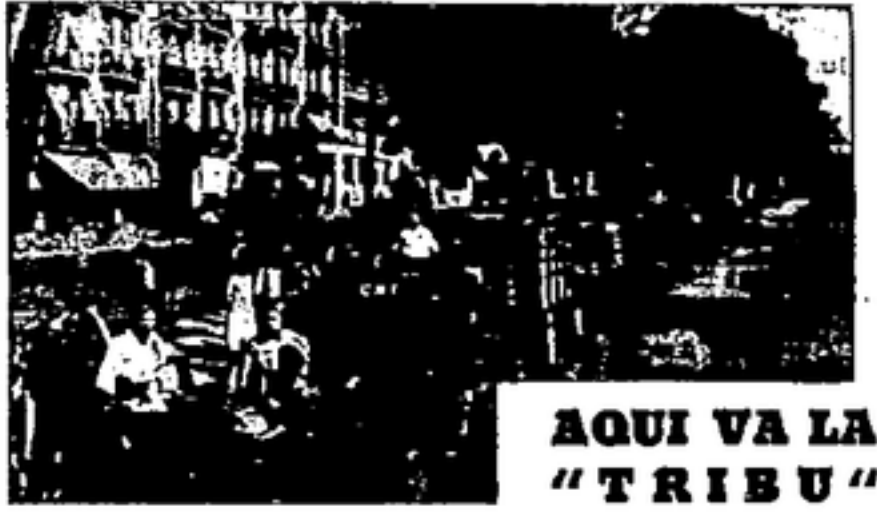
AQUI VA LA "TRIBU"