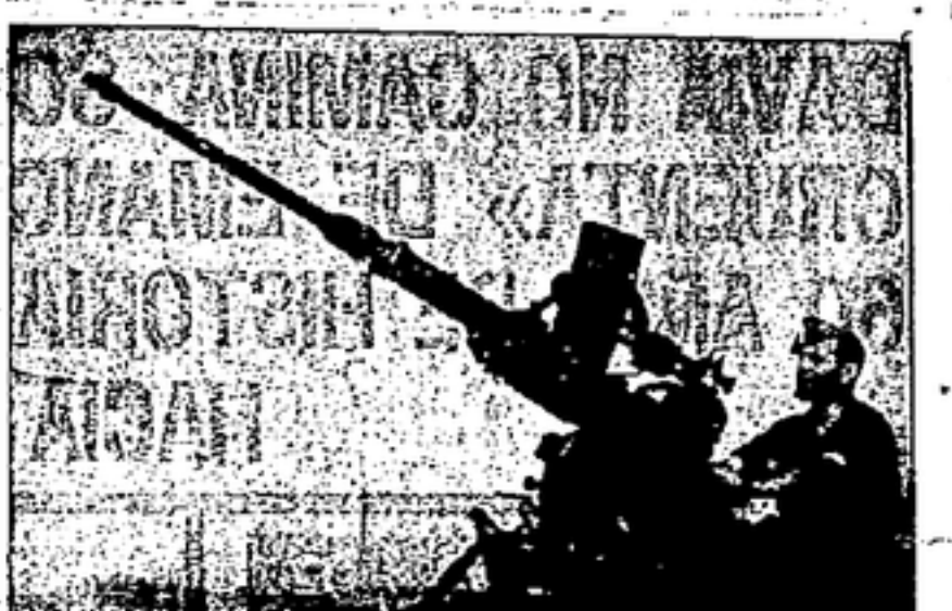
Combatiente revolucionario que defiende la libertad

Octavo. Por conducto de nuestro Comité Peninsular haremos un llamamiento a las Juventudes antifascistas y revolucionarias del mundo entero para que ayuden moral y materialmente a la causa antifascista de nuestro país.