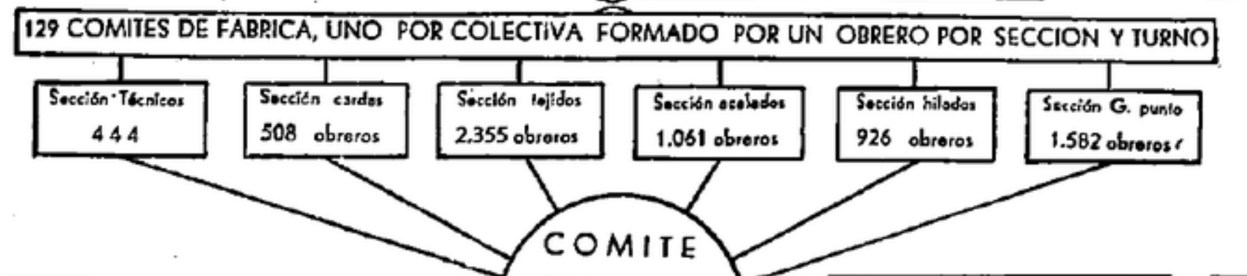
Gráfico de la organización sindical, industrial y comercial Cómo se hace la Revolución