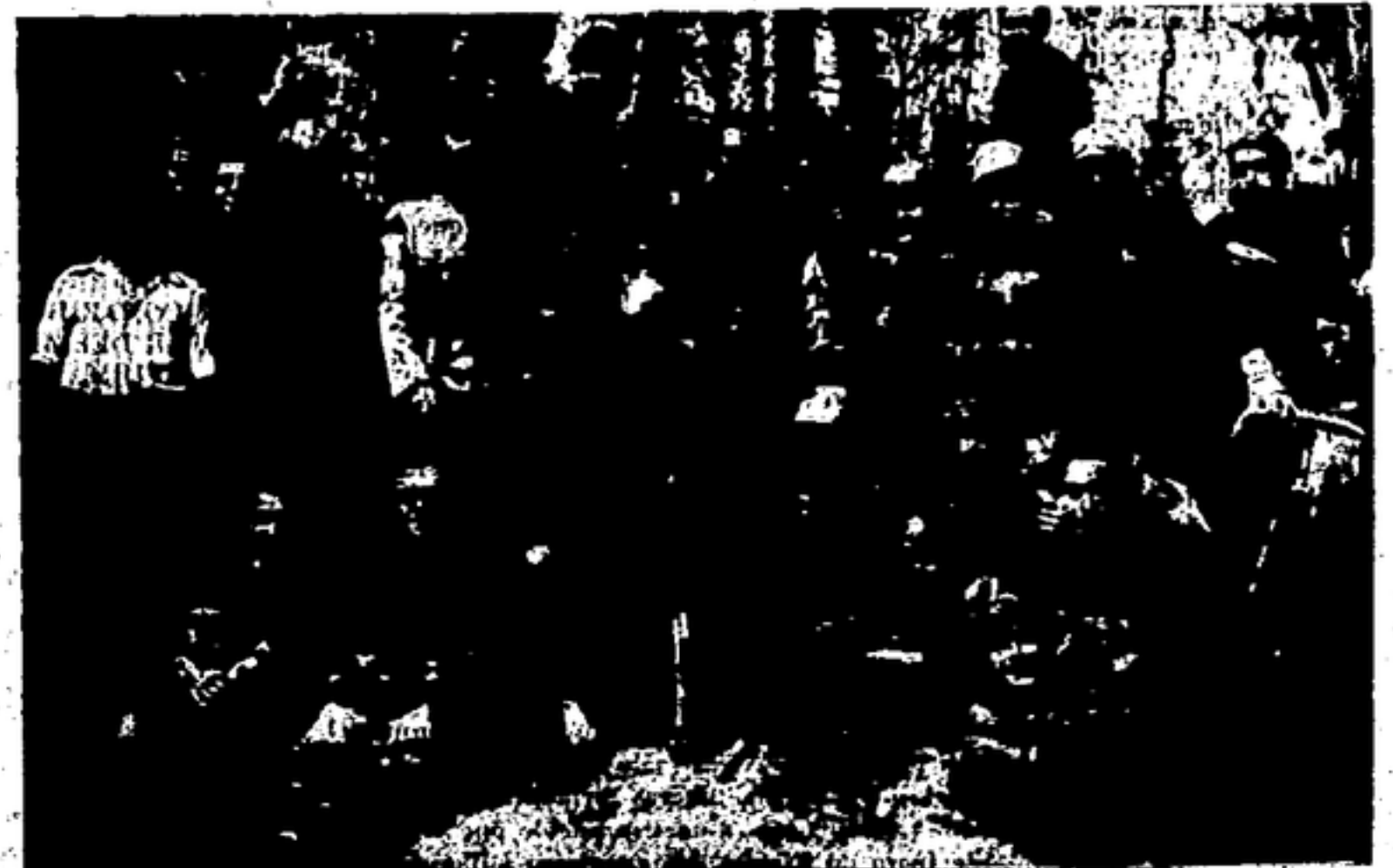
Milicianos de la 70 Brigada de Carabineros, equipados con material cogido a los italianos después de su famoso «cross» forzado (por tierras de Alcarria).

¡Detrás de vosotros, la Revolución Española!