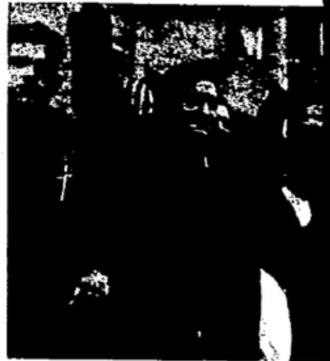
Campeñinos que se integran al movimiento revolucionario, llenos de entusiasmo.

Pero el campesinado de la C. N. T., en su magnífica reconstrucción de carácter socialista, llevado siempre por un espíritu revolucionario auténtico, consciente del valor renditivo superior del trabajo colectivo, situado a la altura de sacrificio que la guerra impone, trabajando sin jornada fija, distribuyendo salarios reducidísimos, practicando la solidaridad en forma ejemplar, tropezó con obstá-