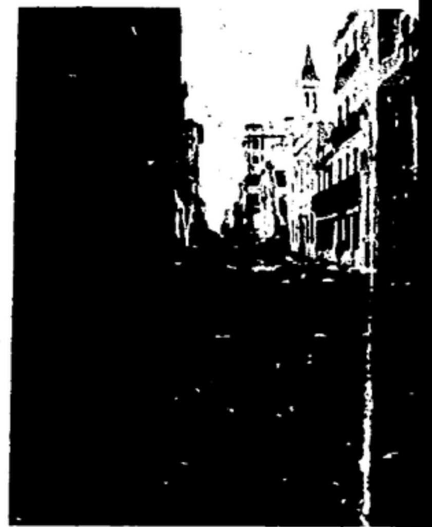
Barricadas en Huesca

Se intenta una restauración de procedimientos gubernamentales a la usanza burguesa, con el fin de anular a los órganos de defensa revolucionaria.