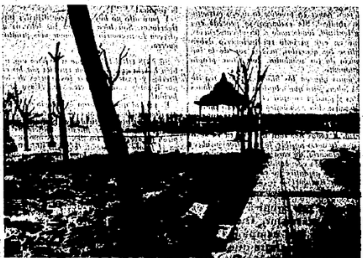
El madrileñísimo Paseo de Rosales que ha sido batido furiosamente por la artillería fascista.