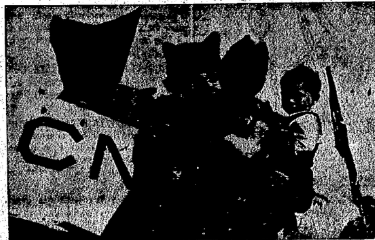
Ella, él y el pequeño: todos antifascistas

1 trimestre, pesetas . . . . . 4'— 1 semestre, pesetas . . . . . 8'— 1 año, pesetas . . . . . 16'—