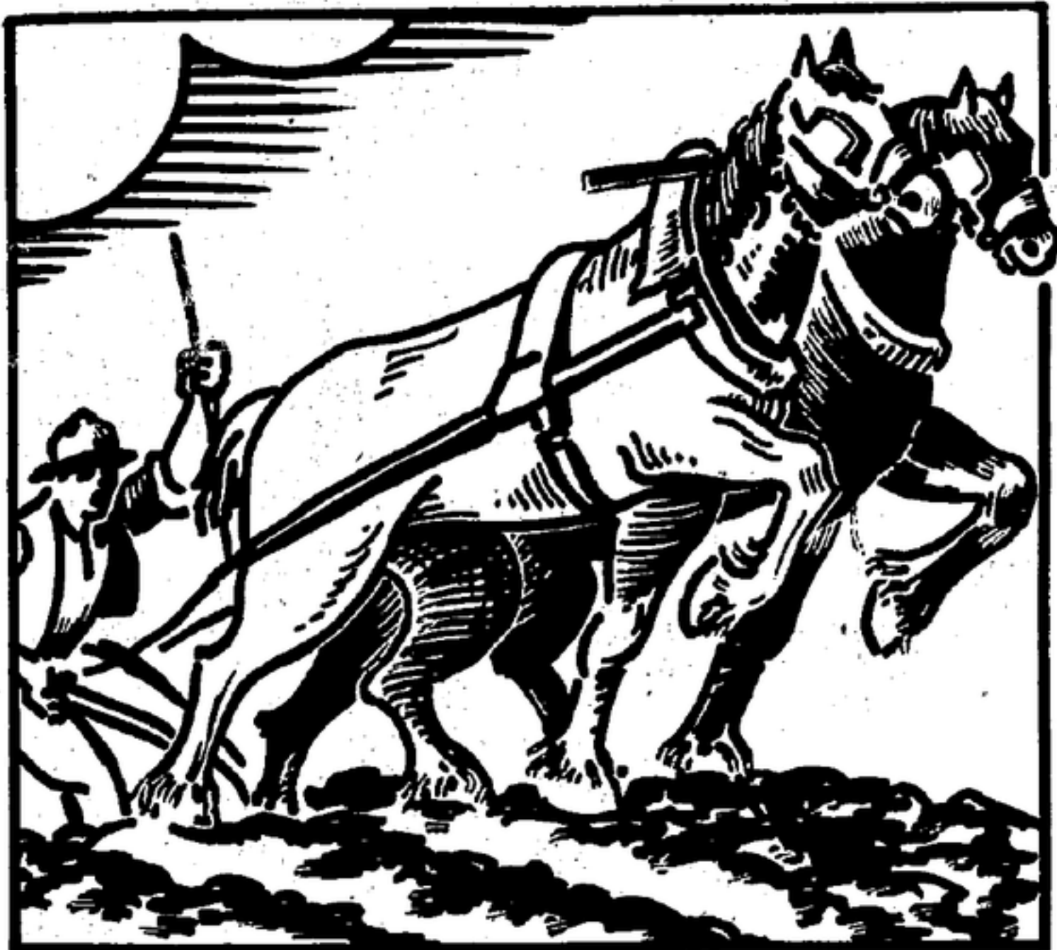
La labranza de ayer...

Mollet, 3 de septiembre de 1936. Nota: Todos los padres o tutores vendrán obligados a inscribir a sus hijos o ahijados en la oficina de este Comité, Jaime I, 14 (antes Academia Mollet), todos los días de 9 a 12 y de 4 a 7 hasta el día 5 de septiembre.