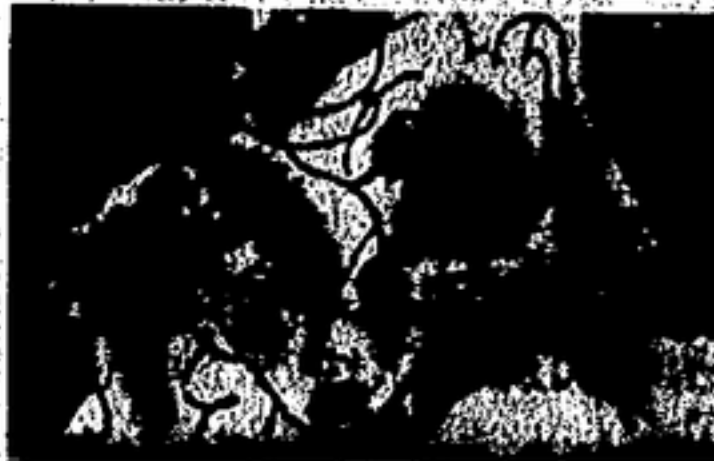
Los que se divierten: frutas, trépanos y ametrallables