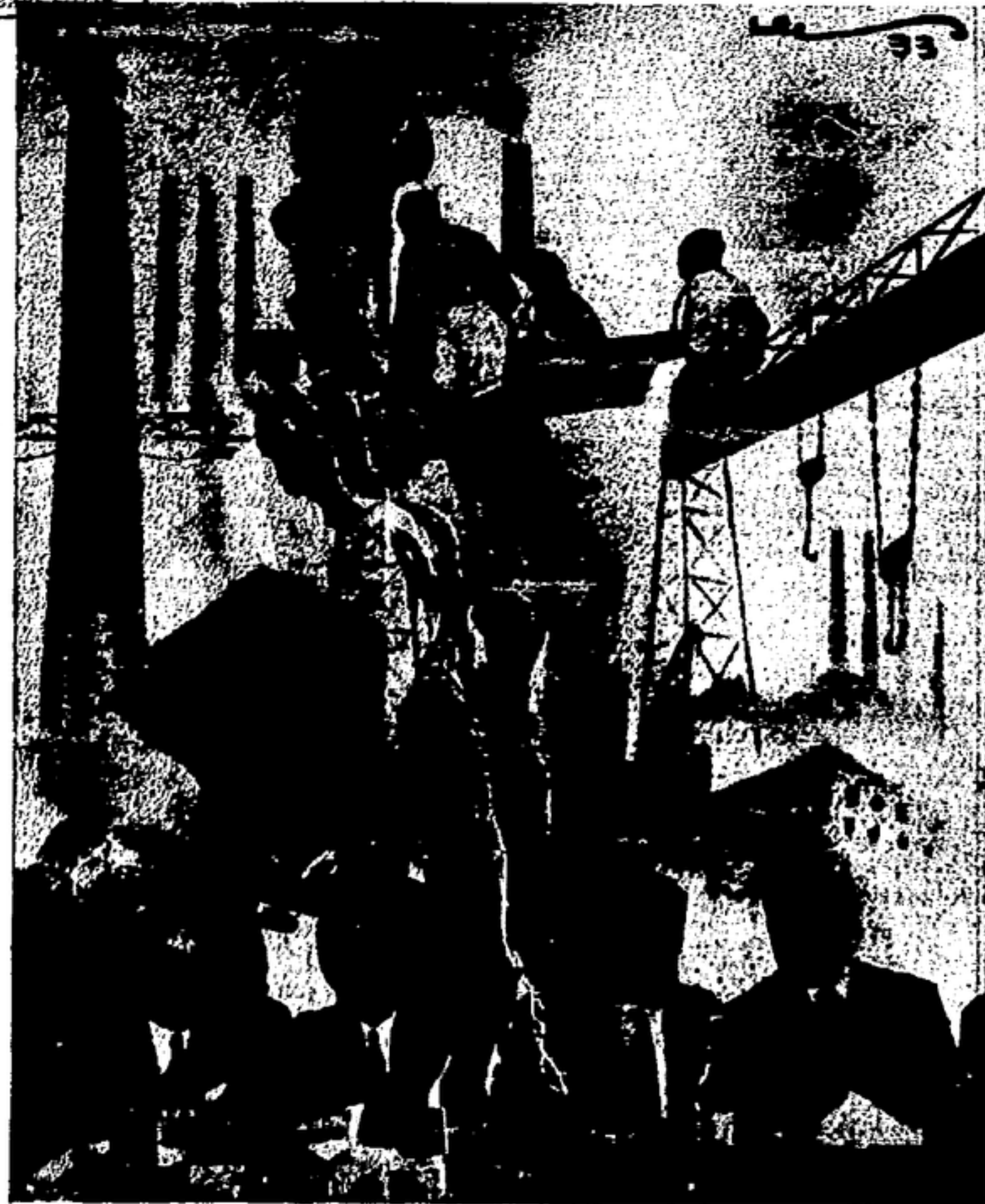
La economía política de la República ha fracasado, los intelectuales de este régimen de comilonas inventan brindan con los políticos de historial más abyecto. Y mientras se hunde todo lo pueblo y fracasa el sistema capitalista y en el de las copas de champagne se reflejan los rostros crispados de angustia de los hambrientos, las fábricas, las grandes industrias a las que la burguesía ha exprimido todo lo que podía proporcionarle un placer, un vicio, son poco a poco que precipita el fin. En el mañana post-revolucionario cantarán las máquinas un potente himno liberador.