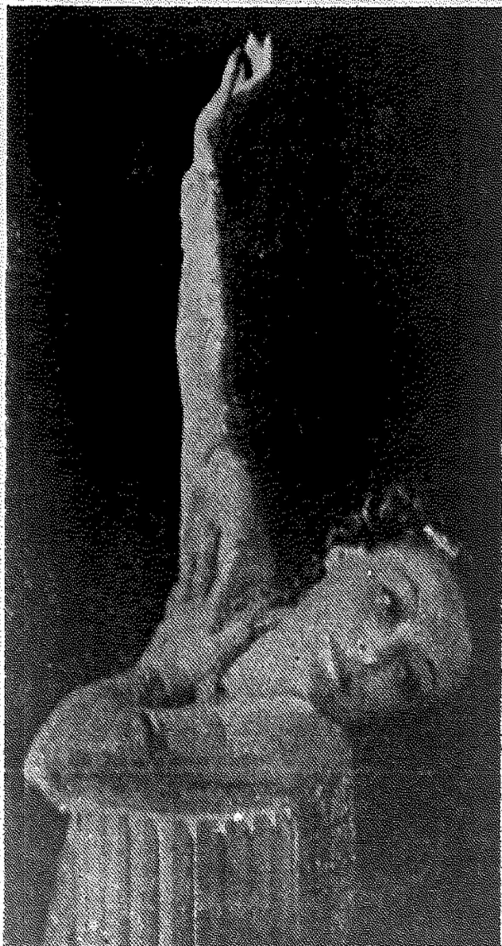
JOAN CRAWFORD Estrella de Cine